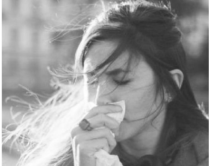
የላቸውንም ንክኪ መቀነስ አለባቸው። በተለይ ደግሞ እነዚህን ምልክቶች የሚያሳይ ሰው ምርመራ ማድረግና እራሱን ከሰዎች መለየት እንዳለበት ኤጀንሲው አሳስቧል።

ዩኤ ውስጥ በኮቪድ የተያዙ ሰዎች ቁጥር 4.9 ሚሊዮን የደረሰ ሲሆን መንግሥት በነጻ ሲያከናውነው የነበረው ምርመራም ባሳለፍነው ሳምንት ተጠናቋል። የዩኤ የጤና ደህንነት ኤጀንሲ እንደሚለው ሰዎች አሁንም ቢሆን በተቻላቸው መጠን ከቢታቸው ላለመውጣት መሞከርና ከሌሎች ሰዎች ጋር