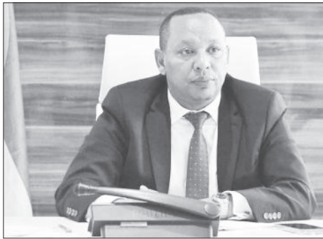
ሸት ተስፋዬ በልጅገ