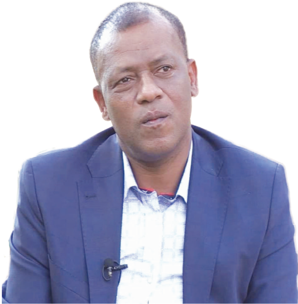
ኮሎኔል አበበ ገረሱ