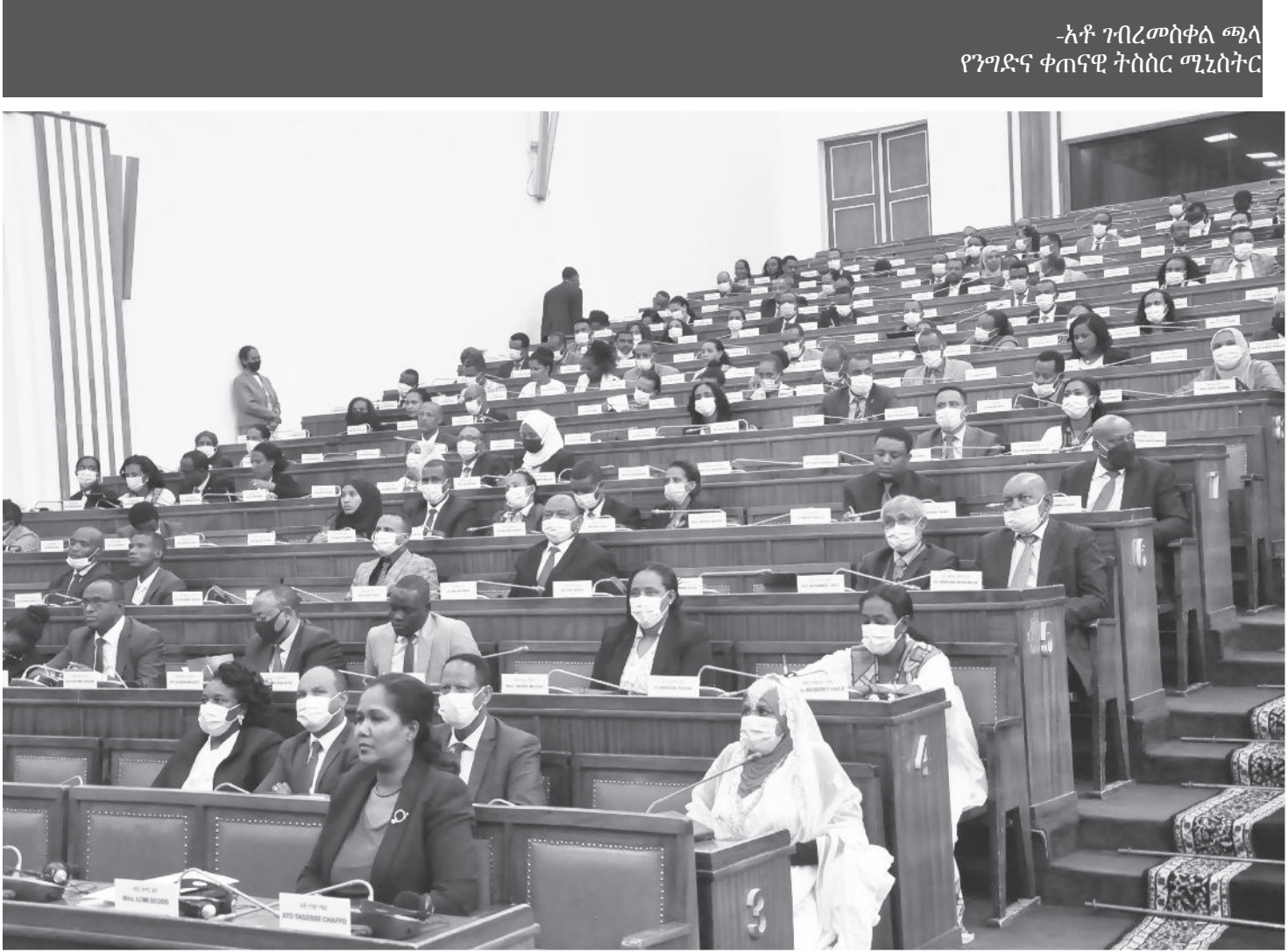
-አቶ ገብረመስቀል ጫላ የንግድና ቀጠናዊ ትስስር ሚኒስትር

አቶ ገብረመስቀል፡- ከመሰረታዊ ሽቀጦች ጋር በተያያዘ መንግሥት በተለይም ዘይት ስኳር ስንዲ በማቅረብ የሕብረተሰቡን ፍላጎት ለማሟላት ትልልቅ ውሳኔዎችን ወስኗል። ለምሳሌ ዘይትን ለማምረት ወደ 4 መቶ ሚሊዮን ዶላር መድቦ የአገር ውስጥ ባለሀብቶች ዘይት ከቀረጥና