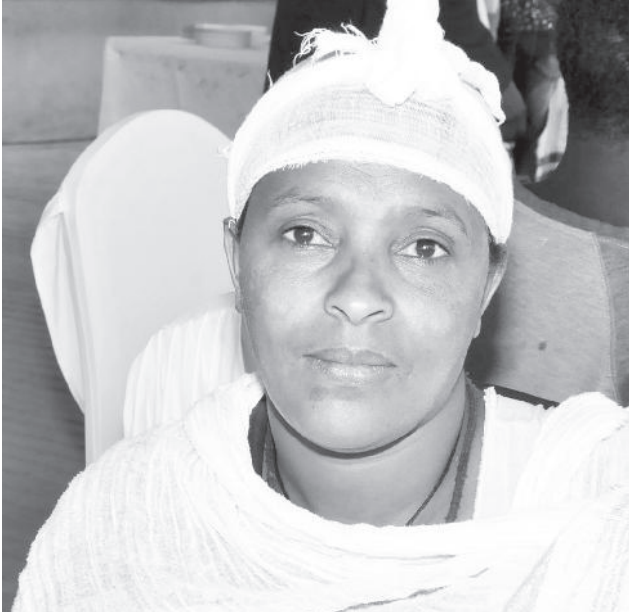
ወይዘሮ ምስራቅ ባዩ