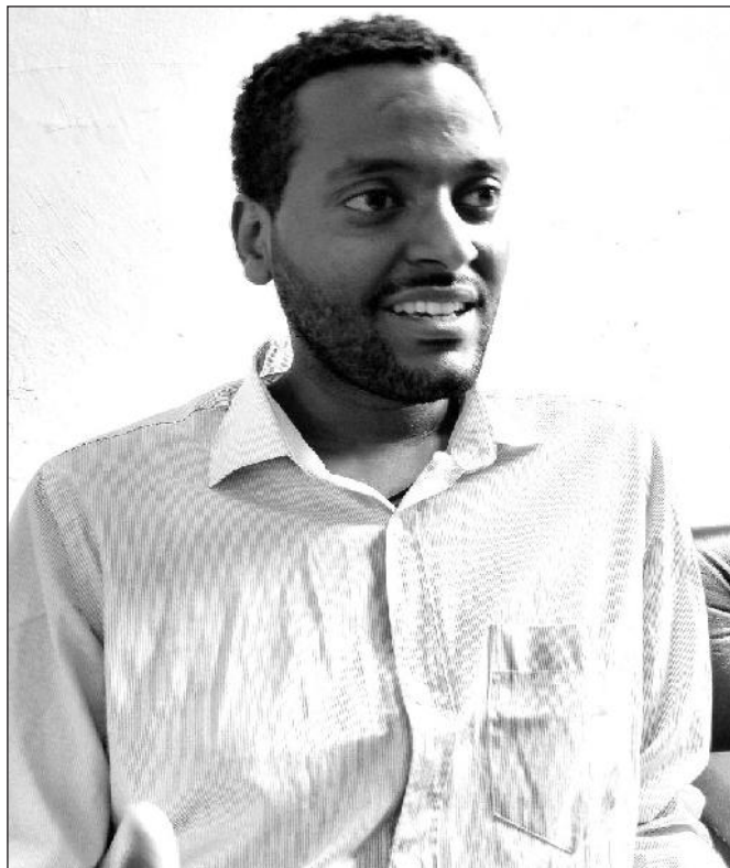
ፊት:- ሕጻናት ጸጋዬ

የመድሃኒቶች በጀርባዎች መለመድ በተለያዩ ምክንያቶች የሚከሰት ሲሆን በተለይ ጀርባዎች የተለያዩ ነገሮችን በመጠቀም ለአብነት ኬሚካሎችን