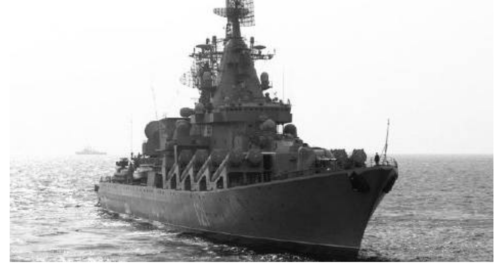
እጅግ ውስብስብና ግዙፍ የጦር መሣሪያዎችን መሸከም የምትችለው ሞስኮ ከ2015 ዓ.ም በላይ ከብደት አላት።

ሞስኮ ግዙፍ ሚሳኤል ተሸካሚ የጦር መርከብ በሶቪየት ግጭት ጊዜ የሩሲያ ወታደሮችን በከፍተኛ ሁኔታ ማግዘ ይነገራል።