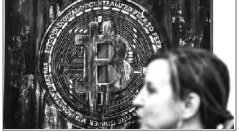
ፕሮግራሞቹን ለማጠናከር እና ማዕቀባቸውን ለመቋቋም እንደምትጠቀሙባቸው አሳውቋል።

በሰሜን ኮሪያ ላይ የተጣለውን ማዕቀብ የሚከታተለው የተባበሩት መንግሥታት ቡድን ፒ.ዮንግዮን የተዘረፉ ገንዘቦችን የኒውክሌር እና የባለስቴክ ሚሳኤል