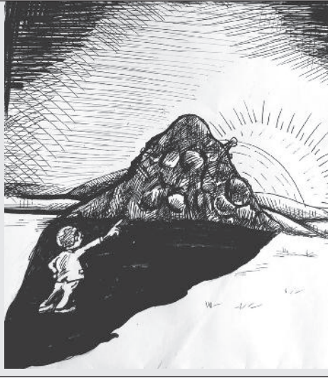
ዕድል፣ የነገን ሌላ ችግርና ፈተና መሻገሪያ ድልድይ አድርገን ልንጠቀምባቸው ይገባል። ይህ ሲሆን ጉዟችንን ባመንነው ፈጣሪ የተመራ፣ ሂደታችን በማስተዋል የተቃኘ፣ ችግሮቻችንም በጽናት የሚታለፉ ይሆናሉ። እኛም ነገን ከማለም ባሻገር፣ የነገ ሕልማችን መዳረሻ መንገዳችንን እውቀን የምንጓዝ፣ ፈተናዎችንም አደናቅፈው የማይጥሉንና ከጉዟችን የማይገቱን እንሆናለን። ምንም እንኳን ዛሬ ላይ በብዙ ችግርና መከራዎች፣ በከፋ ዋይታና ስቆታዎች ውስጥ ብንሆንም፣ እነዚህ ሁሉ አላፊ እንጂ አብረውን ኗሪ አለመሆናቸውን በመገንዘብ ዕይታችን ከዛሬ ችግሮቻችን ባሻገር ባሉ የነገ ተስፋዎቻችንን እውን ማድረግ ላይ ሊሆን ይገባል።

ለዚህ ደግሞ መከራን በመከራነቱ ብቻ ሳይሆን መከራነቱንም ሳንዘጋጃ፣ በሚያጋጥሙን መከራዎች፣ በሚፈትኑን ችግሮች ውስጥ ሁሉ መከራና ችግሮቹን ለነገ የተሻለ ነገር መተለማይ