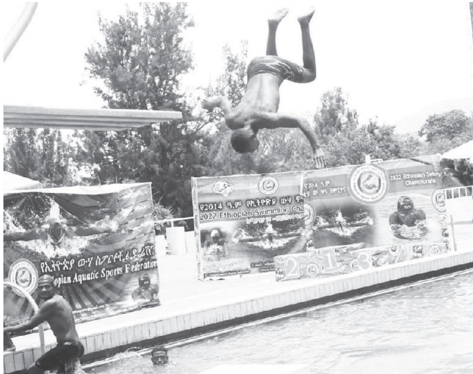
በሻምፒዮናው ተሰጥቶ ያሳቸው ወጣቶች ጠንካራ ተፎካካሪ መሆን ትሰዋል።