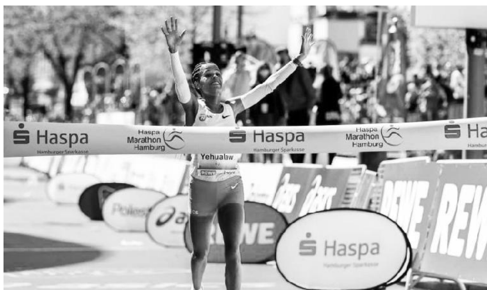
አትሌት ያለምዘርና የኋላው የመጀመሪያ የማራቶን ውድድርን በአሸናፊነት አጠናቃለች።

በርካታ የዓለም ምርጥ አትሌቶችን ባቀፈው «ኤንኤን ማጅሮን» ስልጠና ቡድን አባል የሆነችውና በአሰልጣኝ ተሰማ አብሸሮ የምትሰለጥነው ብርቱዋ አትሌቷ፤ ግማሽ ማራቶንን ከ10 ጊዜያት በላይ በመሮጥና አሸናፊም በመሆን ከፍተኛ ልምድ አላት።