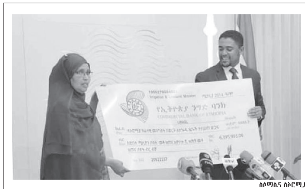
ሰሶማሌና ሰሮሚያ ክልል ድጋፍ ተደርጎል