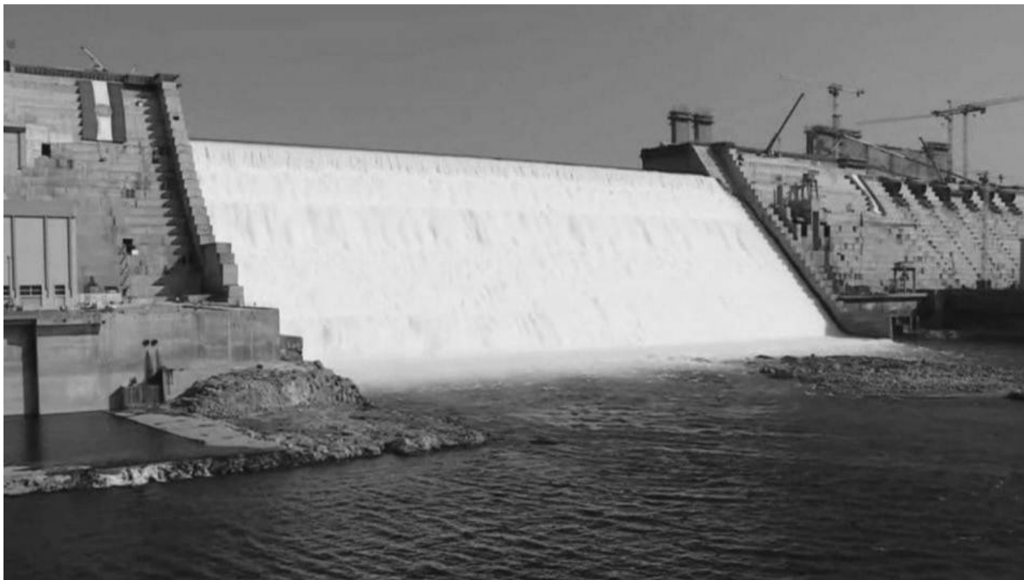
በእንጉርጉሮ ሲገለጽ የኖረው ዓባይ ሕዱን ደግሞ በህዳሴ ግድብ ግንባታ እየተገባደደ መምጣት ሀይል ወደ ማመንጨት መሸጋገሩን ብእሮች ይገልጻሉ ጀምረዋል

እንደ ጸሐፊው ተውኔቱ ገለጻ፤ ሀብረተሰቡ እየተለወጠ፣ እየተማረና እየወቀ ሲመጣ ሁኔታዎቻችንም ተለወጡ። ከምንጭነቱና ከኩራትነቱ አልፎ ጠቀሜታ የሚሰጥ