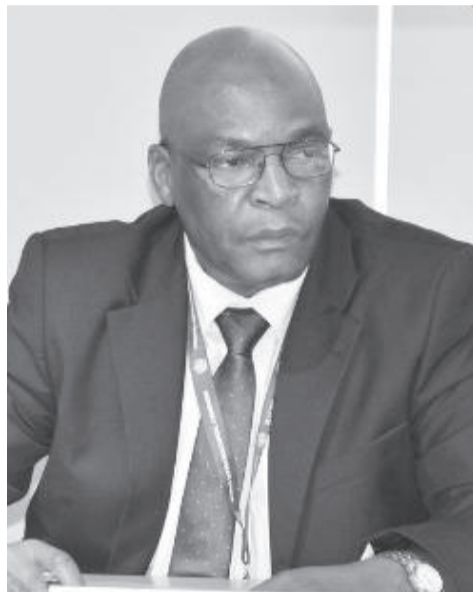
የውሃ አማራጭ እንዲያገኙ ይረዳል ብለዋል።

በተለይም ተፈጥሯዊ ዳመናን ወደ ዝናብ በመቀየርም ሆነ ሰው ሰራሽ ደመናን በማበልጸግ የሚከናወነው ተግባር በድርቅ ለሚጎዱ የአፍሪካ አገራት ተጨማሪ