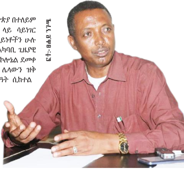
ፎቶ፡- ጠቅላይ ገገማ