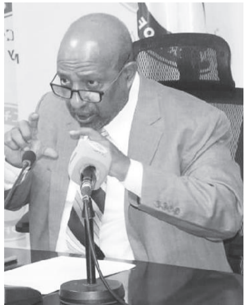
ፕሮፌሰር ብርሃኑ ነጋ

በቀጣይም እንደዚህ አይነት ችግሮች እንዳይፈጠሩ የተጠናከረ ሥራ ለመሥራት ከስምምነት ላይ መደረሱ ተገልጿል።