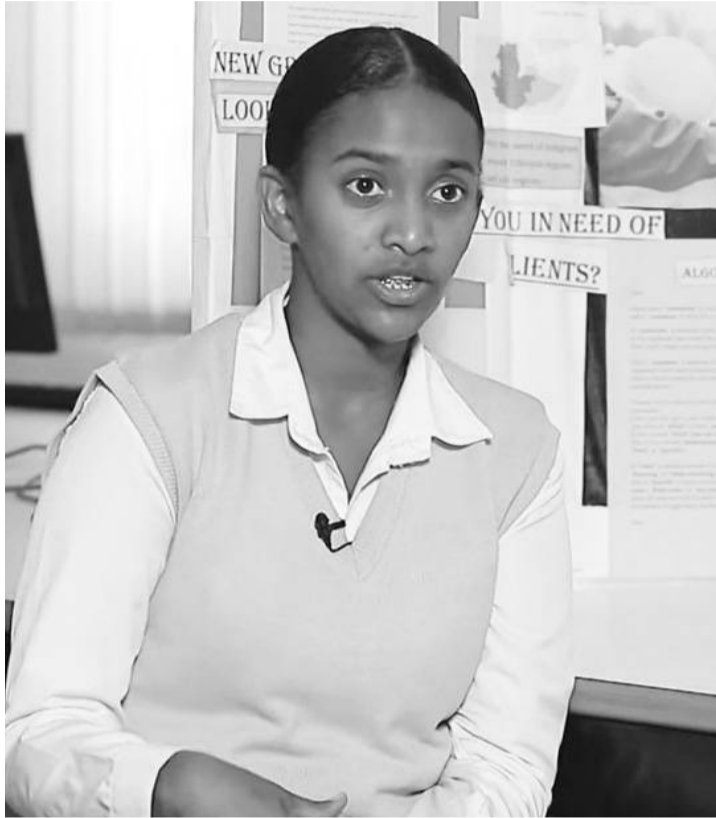
ተማሪ በፀሎት በቀለ

በተለያዩ ጊዜም በወጣት የፈጠራ ባለሙያዎች የሰው አልባ ድሮን፣ አውሮፕላኖችና መሰል የዲጂታል ቴክኖሎጂ መተግበሪያዎች መሰራታቸውንም መረጃዎች ያመለክታሉ። እነዚህ የፈጠራ ውጤቶች በ2025 ዲጂታል ትራንስፎርሜሽን ስትራቴጂ ትግበራን ለማሳካት ከሚያግዙ ክህሎቶች አንዱ እንደሚሆን መገመት ይቻላል። ለዛሬም የዝግጅት ክፍላችን በዚህ አምድ ላይ መንግስት በልዩ ትኩረት ይዞ ከዘርፉ ባለሙያዎች አካላት ጋር እየሰራ የሚገኘውን የሳይንስና ቴክኖሎጂ የፈጠራ ክህሎት ባለሙያዎችን የመደገፍ ስራን የሚያመለክት ጉዳይ ለማንሳት ወድድናል። በዋናነትም ሁለት ወጣትና በትምህርት ላይ የሚገኙ የቴክኖሎጂ ፈጣሪ ወጣቶችን በአንግድነት በማቅረብ ክህሎታቸውን ተጠቅመው