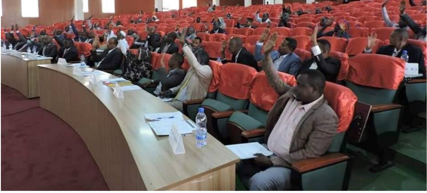
በማሻሻያ አዋጁም አሰሳ ወረዳ የሚለው ቀርቶ «አራ ወረዳ» እና «አብርሃም ወረዳ» ተብሎ በሁለት ወረዳዎች የተዋቀረ ሲሆን፤ በዚህም ለሕዝብ

ወረዳው ካለው የቆዳ፣ የቀበሌ እና የሕዝብ ብዛት፣ የአስተዳደር ምቹነት፣ ለሕዝቡ የመልካም አስተዳደር ችግሮች በወቅቱ ምላሽ ለመስጠት፣ የአገልግሎት አሰጣጥ ምቹነት እኳም በመወያየት ወረዳው በሁለት ወረዳዎች እንዲዋቀር የቀረበው የማሻሻያ አዋጅ በሙሉ ድምጽ ጸድቋል።