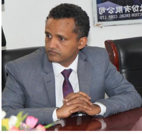
ፕሬዚዳንቱ፤ ለቀዳሚነቱም በየጊዜው በከፍተኛ ደረጃ እየጨመረ ያለው የባንኩ ደንበኞችና ነገር ደንበኞች በታማኝነት መቀጠላቸውን በማሳያነት አንስተዋል።

ባንኩ እስካሁን ድረስ በየጊዜው አሠራሩን እያዘመነ ቀዳሚነቱን አስጠብቆ እየተጓዘ ነው ያሉት ምክትል