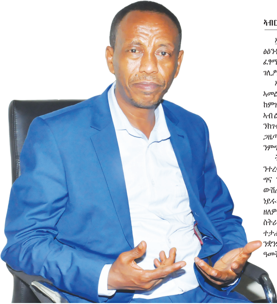
አይተ ፍቃዱ ከተማ