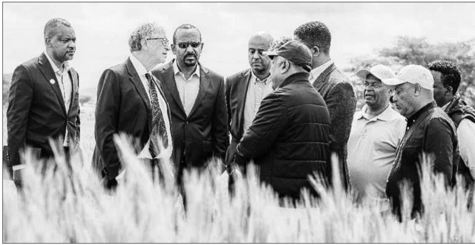
ሸዋ ወረዳ ዱግዳን ኢሉ 'ውን ማእኸል ምርባሕ ደርሆን ጉጅለ ኢንቨስትመንት ኣዳማን ዑደት ገይርና።

ምስ ርእሰ ምምሕዳር ብሄራዊ ክልላዊ መንግስቲ ኦሮሚያ ኣይተ ሸመልስ ኣብዲሳ ብምዃን 'ውን ዓቢይቲ መርኣያ ኢትዮጵያ ብምግብራ ሳርሳ ንምኽካል ትገብሮ ሃዕሪ ንዝኾኑ ብክላስተር ኣብ ዝለምዐ ስርዓይ ኣብ ዘገቡ ምስጋና