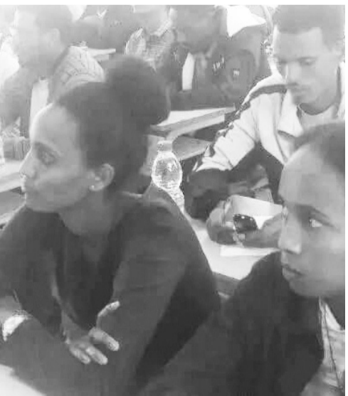
ትግራይ ሓበሬታን ርክብን ከተማ መቐስ ብምጥቃስ ፀብቢዮ።