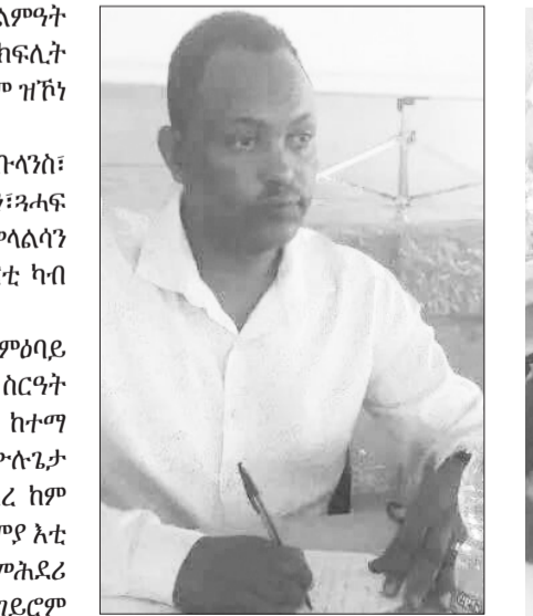
ኣብ ሕብረተሰብ ስራሕ ስራሕቲ ምዕባይ ግንዛብ ከምዘድሉ ሓቢሮም ክብል ቢር ጉዳይ ኮሚኒኬሽን

ተሳተፍቲ እቲ መድረሽ ብወገኖም እዚ ስልጠና ምድላው ወሳኒ ከምዝኾነ ብምግላፅ እቲ መምርሒ ሓዲሽ ምስ ምዃኑ