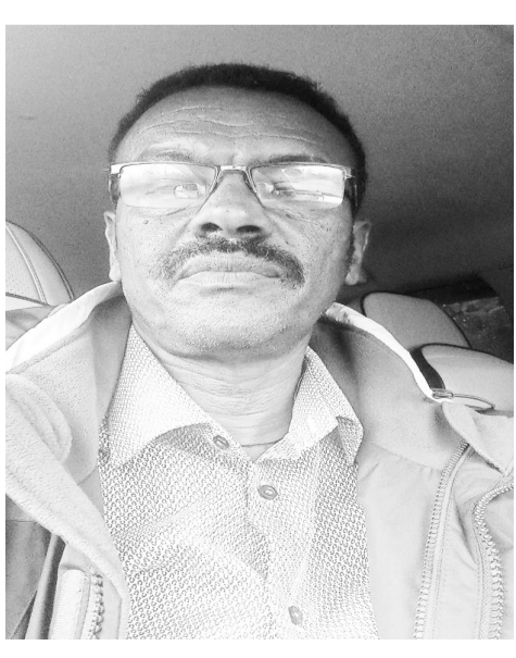
ኣይተ ጎበዛይ ኣረፋይን

10 ሓምሌ ኳዕትን ተኸልን ክጠቓለል 'ዩ ዝብል ትልሚ ኣለና፣ ምስ ተወከልቲ ልምዳት 'ውን ዘተ ኣካይድና ኢና፣ ኣብዚ ክረምቲ እቲ ዝግበዩ ስራሕና ተኸሊ ምትኻል 'ዩ ክብሉ ኣብሪሆም።