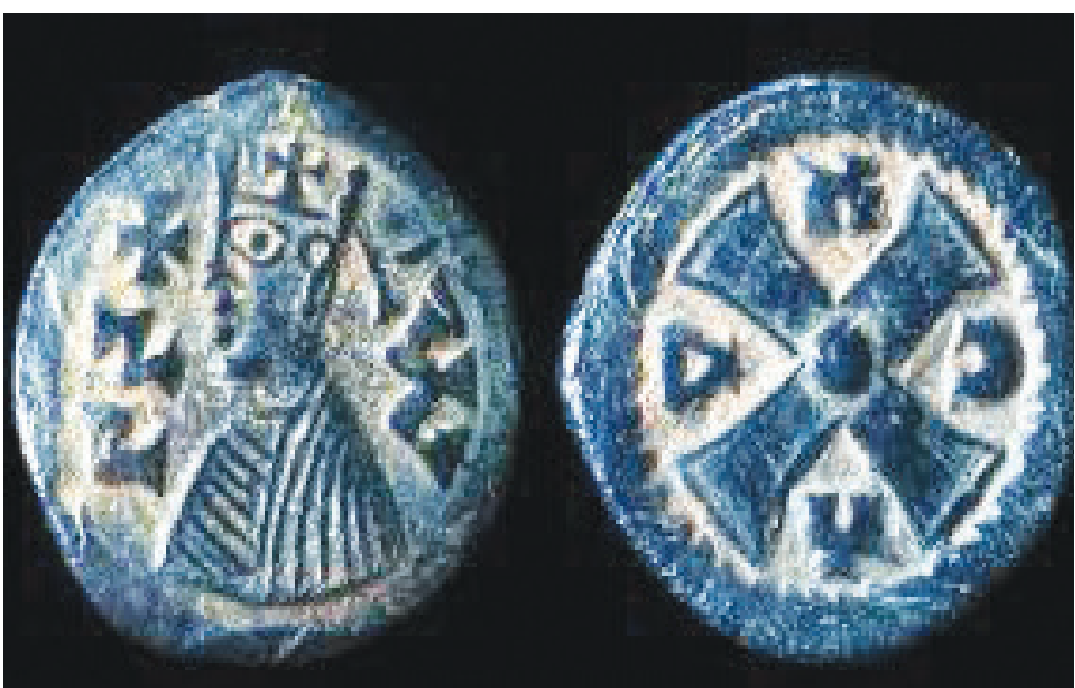
ጥንታዊዎን ሳናቲም ኣክሱም

ዝበሃል ጠንካራ እምን ዝተፀረቡ ኮይኖም ብቐሊሉ ዘይሰባቡ ፍሉይ ዓይነት ግራናይት ኣእማን 'የም። እዞም ታሪኻዊ ሓወልቲታት ረቂቕ ትርጉም ዘለዎም ኮይኖም ኣዝዮም ብዘደንቑ ጥበብ ዝተሰርሑ 'የም። እዞም ሓወልቲታት ኣብ ታሪኽ ኣኸሱም ወሰንቲ ኣካላት ብፍላይ ድማ ንነገሶታት ወይ ካህናትን ንምኸባር ዝውዕሉ ከምዝነበሩ ይዝረብ።