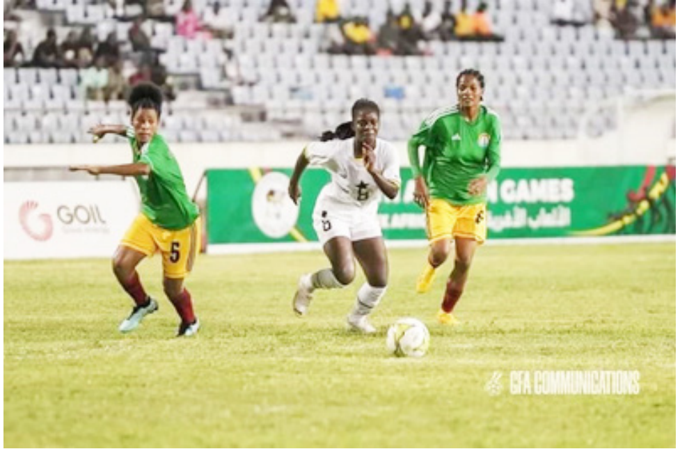
ውፅኢት ንምምጻእ ተለማ 'ያ። ብሓራሻ 149 ኣትሌታት ዝሓቁፍ እቲ ጉጅለ ብኣትሌቲክስ ፣ ኩዕሶ እግራ ፣ ብስክሌት ፣ ወርልድ ቴኦንዶ ፣ ሜዳ ቴኒስ ፣ ጠረጴዛ ቴኒስ ፣ ሓመሳ ማይን ኩዕሶ ስኩዕትን ስፖርት ከትጅኻኸር 'ያ። በዚ መድረኽ ውድድር ብዙሓት ሜዳልያታት ብምምዝጋብ ቀዳማይቲ ዝኾነት ግብፂ እንትኾነውን፤

ኣብ መላእ ፀወታታት ኣፍሪካ ውድድር ዝካየደሎም ስፖርት እቶም 7 ስፖርትታት ኣሎምጊክ 'ዮም። ካብዚኦም ኢትዮጵያ እቶም ሓሙሽተ ( ኣትሌቲክስ ፣ ብስክሌት ፣ ሓመሳ ማይ ፣ ጠረጴዛ ሜዳን ቴኒስ )