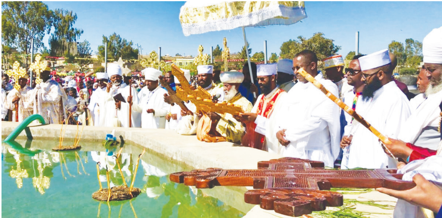
ኣከባብራ ባዓል ጥምቀት

ብብዓመቱ ጥሪ 11 ዝኸበር ባዓል ጥምቀት ኣብ ከተማ ኣዲስ ኣበባ ብፍላይ ጃን ሜዳ ፀወታ ሃርሞኒካ ካብ ጫፍ ናብ ጫፍ መድመቕ እቲ ባዓል 'ዩ። መናእሰይ ካብ ዝተፈላለዩ ከባቢ ተኣኪቦም ክቢ ብምስራሕ ይገወቱ። ቢዚ ምኽንያት ድማ ሃርሞኒካ መለላዩ ጥምቀት ኾይኑ 'ዩ። ካልእ ድማ ኣብ ባዓል ጥምቀት ደቂ ተባዕቲዮ ንሓዳር እትኸውን ጎርዞ ዝመርፅሉ እዋን 'ውን 'ዩ። ንባዓል ጥምቀት ክኸበሩ ዝመገ ደቂ ኣንስትዮ እታ ዝመረገ ጎርዞ