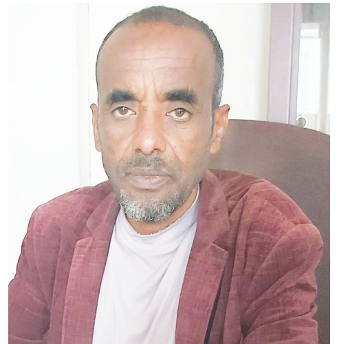
አይተ የማነ ገድሱ