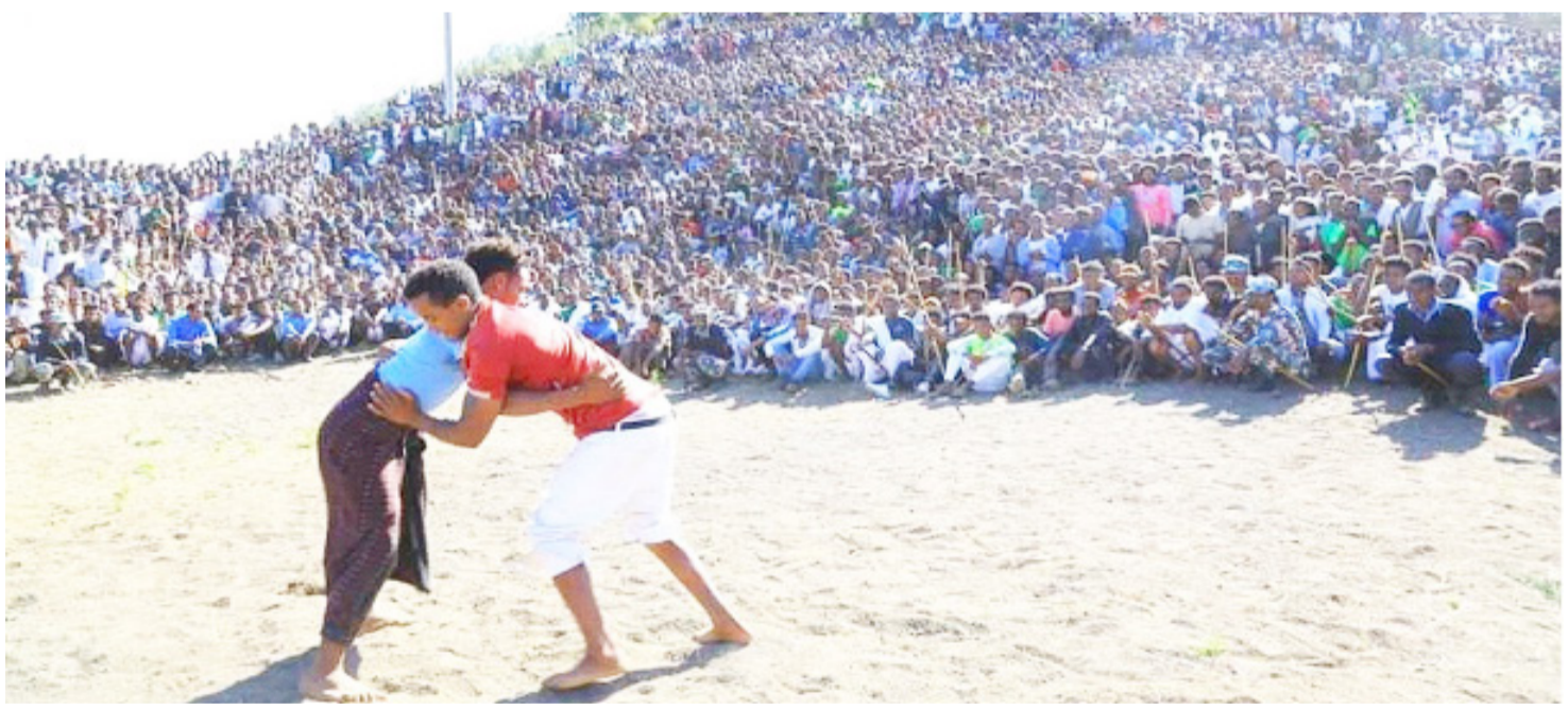
ቦዓል ጥምቀት ምኽንያት ብምግባር ባህላዊ ገደል ኣብ ከተማ ማይጨው እንትካየድ

መግለፂ መንነትና ካብ ዝኾኑ ባህልናን ታሪኽናን ሃይማኖትናን ብሓፈሻ እንክብርም ዝተፈለለዩ ዘይድህሰሱ ሓድግታትና ቦዓላትናን መርኢያ ዘለና ባህላዊ ፀጋታት 'ዮም። ኣብ ትግራይ ኣብ ዝተፈለለዩ ሽባባታት ሃይማኖታዊ ባዓላት ዝኸበሩ ኾይኖም፤ ኣብ ሓደ ሓደ ቦታታት ድማ ብፋሉይ ትኸረትን ብፈሉይን ድሙቕን ዝኸበረሎም ሽባባታት ኣለው 'ዮም ። ንኣብነት እንተራእና 'ውን "ኣሽንዳ" ኣብ መቐለን ዓብይ ዓድን "ዓይኒ ዋሪ" ብዝበል ስም ድማ ኣብ ኣክሱምን ከባቢኡን ካብ ኻልኣት ሽባባታት ብፍሉይ ብድመቕ ክኸበሩ ንፅዑቡ። ከምኡ 'ውን ቦዓል ሕዳር ፅዮን እንተራእና ብመላእ ኢትድያውያን ብሃንቀውታ ዝፀበይዎ ምስ ጥንታዊ ኣክሱም ሃወልቲ በቢ ዓመቱ ብድምቀት ዝኸበርን ብዙሓት ቱሪስታት ዝርከቡሉ ታሪኻዊ ቦታ 'ዮ። መስቀል እንተራእና ድማ ኣብ ከተማ ዓዲ ግራት ከባቢኡን ምስ ባህላዊ መለሊይኡ ምግቢ ጥሕሎን ሜስን ዝኸበር 'ዮ።