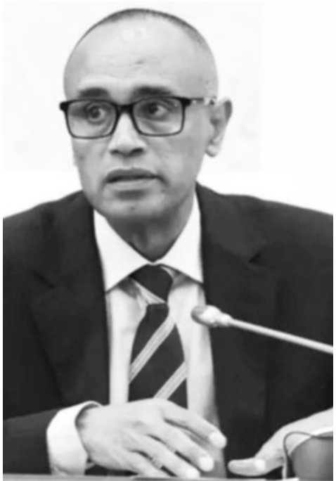
ኣይተ ብናልፍ ኣንዱኣለም

መናእሰይ ናይ መጀመርያ፣ ካልኣይ ብርክት ዩኒቨርሲቲን ትምህርታቶም ኣብ ዘለውዎ ክልል