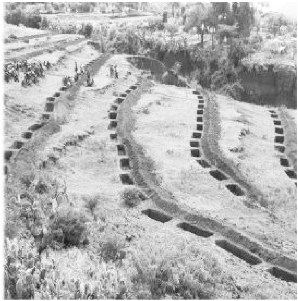
ዕቕባ ሓመድን ማይን

ካብዚ ወፃኢ ኣብተፈላላዩ እዋናት ኣብ እዋን ክረምቲ ዝተካብዐ መጠንን ዝርገሐን ዝናብ የጋጥማ 'የ። እዚ ድማ ኣብ ሕርሻዊ ማእቶትን መነብርኡን ሓረስቶትን ኣብ ርእሲ ዝህልዎ ፅልዎ ንብርስት