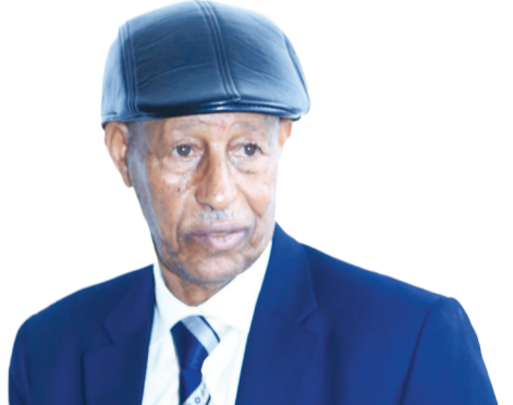
ኣይተ መኮነን ዘለለው

ኢዲሲ አበባ:- ጉጅለ ህወሓት ብናይ ሓሶት ፕሮፖጋንዳ ህዝቢ እናታሰሰ ይርከብ ክብሉ ምስ ሄርሚኦ ቴቪ ዓንሐት ዝገበሩ ነበር ተጋዳላይ ህወሓት ኣይተ ኪዳነ ኣፈወርቂ ገሊፆም። ጉጅለ ህወሓት ሓሶት ብምዃን ናይ ውሽጥን ደገን ማሕበረሰብ ኣብ ምትላል 'ዩ ዝርከብ። ከምዚ ዓይነት ምትላል ቐድሚ ናብ ስልጣን ምምፃኡ ኣትሒዙ ይጥቐሙ ከምዝነበረ ገሊፆም። ጉጅለ ህወሓት ሓሶት ምዃን ጥራሕ እንተይኮነስ ንህዝቢ ትግራይ ተባሂሉ ዝኣቱ ዘሎ ሰብኣዊ ሓገዝ ንባዕሉ እናተጠቐመሉ 'ዩ ዝርከብ፤ እዚ ከይኣኸሎ ህዝቢ ዘለዎ ጉጅለ ህወሓት ብናይ...7