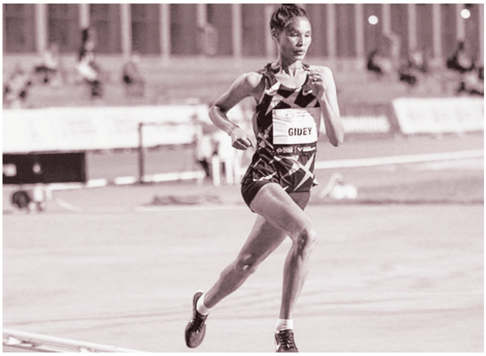
ኣትሌት ለተሰንበት ግደይ ወሰን ፍሉይ ተዘክርታት ኣለኒ። ኣብ ዝመፅእ ቫለንሲያ ማራቶን ድማ ፅቡቕ ግዜ ክሕልፍ ተስፋ እገብር" ክትብል ለተሰንበት ከምዝተዛረበት ኣትሌቲክስ ዊስሊ ዕሑፉ 'ዩ።

"ኣብ ቫለንሲያ ናይ መጀመርታ ማራቶን ክጎዩ ምዃንይ እንትገልፅ ብሓገስ 'ዩ። ምስ ቫለንሲያ ፍሉይ ዝምድና ኣለኒ፤ ኣብ 2020 ዝገበርኩዎ ውድድር 5000 ሜትር ክብረወሰን፤ ኣብ 2021 ድማ ገውድድር ፍርቂ ማራቶን ዘመሓየሽኩሉ ክብረ