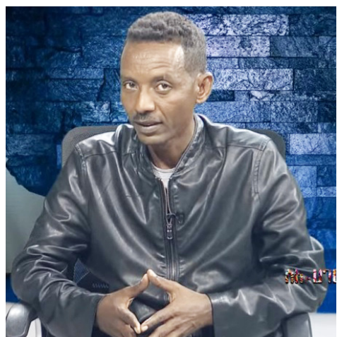
ኢንጅነር የማነ ሃይለ ህወሓት ንህዝቢ እናደናገረ ናብ ኩናት ዘኣቱ ዘሎ ምኽንያት ሰላም እንተሃልዩ ቐድሚ ሕዚ ጀሚሩ

ከም ገለፃ ኢንጅነር የማነ፣ ህወሓት ናይ ባዓሉ ስልጣን ንምንዋሕ ክብል ሕዚ 'ውን ህዝቢ ትግራይ እናደናገረ ናብ ኩናት ክኣቱ እናፈተነ 'ዩ ዝርከብ፤ ንባዓሉ ጥራሕ ዝኣሰብ 'ምበር ንህዝቢ ትግራይ ዝኣሰብ ኣይኮነን። ህዝቢ ትግራይ ቐድሚ ሕዚ ጀሚሩ ብሰንኪ እዚ ጉጅሰ እዚ ኣብ ድኽነትን መኮራን ክወድቕ ክኣሉ ዩ።