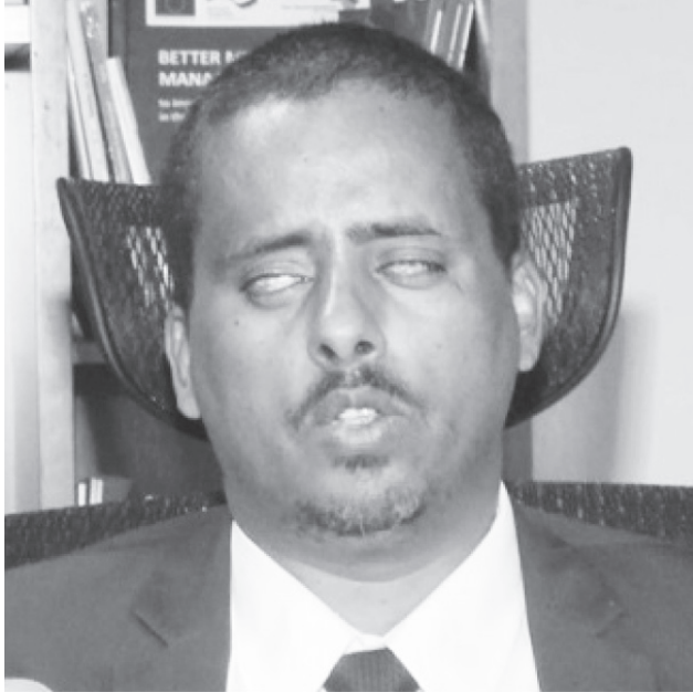
ኣይተ ፍቓዱ ፀጋ፣

"ኣነ ዘይመራሕኹ ሃገር ክትቅፅል ኣይብላን" ኢሉ ዝተልዕለ ግብረ ራዕዲ ህወሓት ሃገር ንምፍራስ ዝተፈለገ