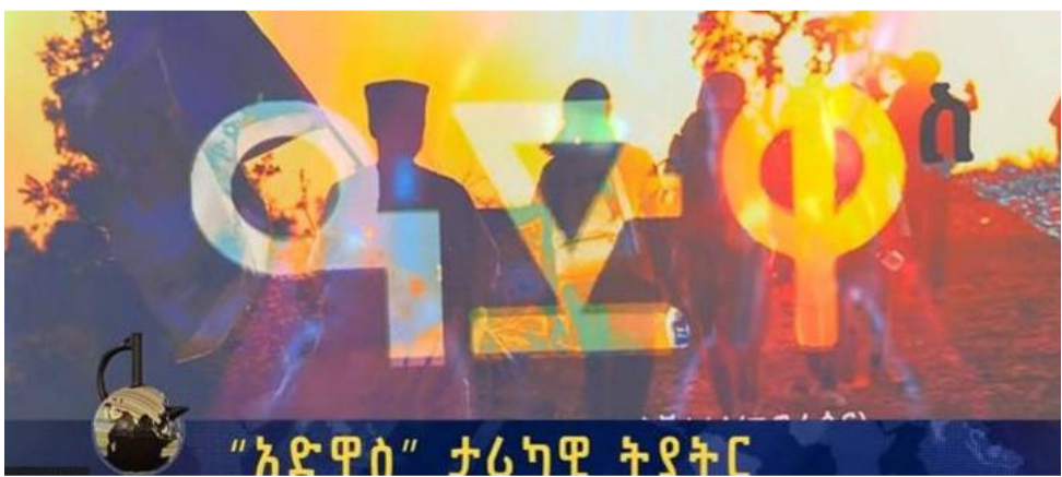
«ኣድዋስ» ተራካዊ ትያትር

ዓድዋ ብዝምልከት ኣብዚ መዚቃዊ ተውኔት ምስታፊይ ዕድለኛ 'ዮ' ዝበለ ሓጋዚ ፕሮጀክት ተሰፋዩ፣ ከም ሓደ በዓል ሞያ ኪነ ጥበብ ኣብ ከምዚ ዝበሉ ስራሕቲ ምስታፊ ይግባእ።