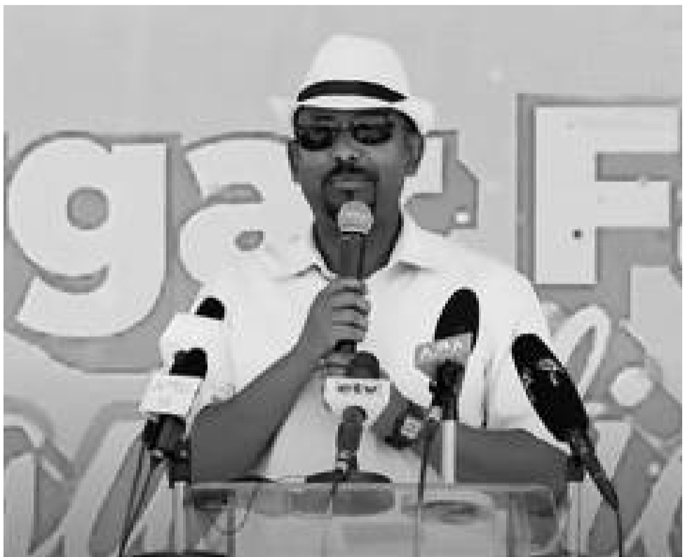
ናይዚ ሰውጢ ... 8

በለስ ተዛዚሙ ስራሕ ክጀምር እዩ እንትብሃል ኣይሸንጎይዶ ህዝቢ ጃዊ ነቲ ስራሕ ዝመርሑ ዝኣምኑ ኣይነበሩን ዝበሉ እቶም ቃል ምእታው ሚኒስትር፣ ናይዚ