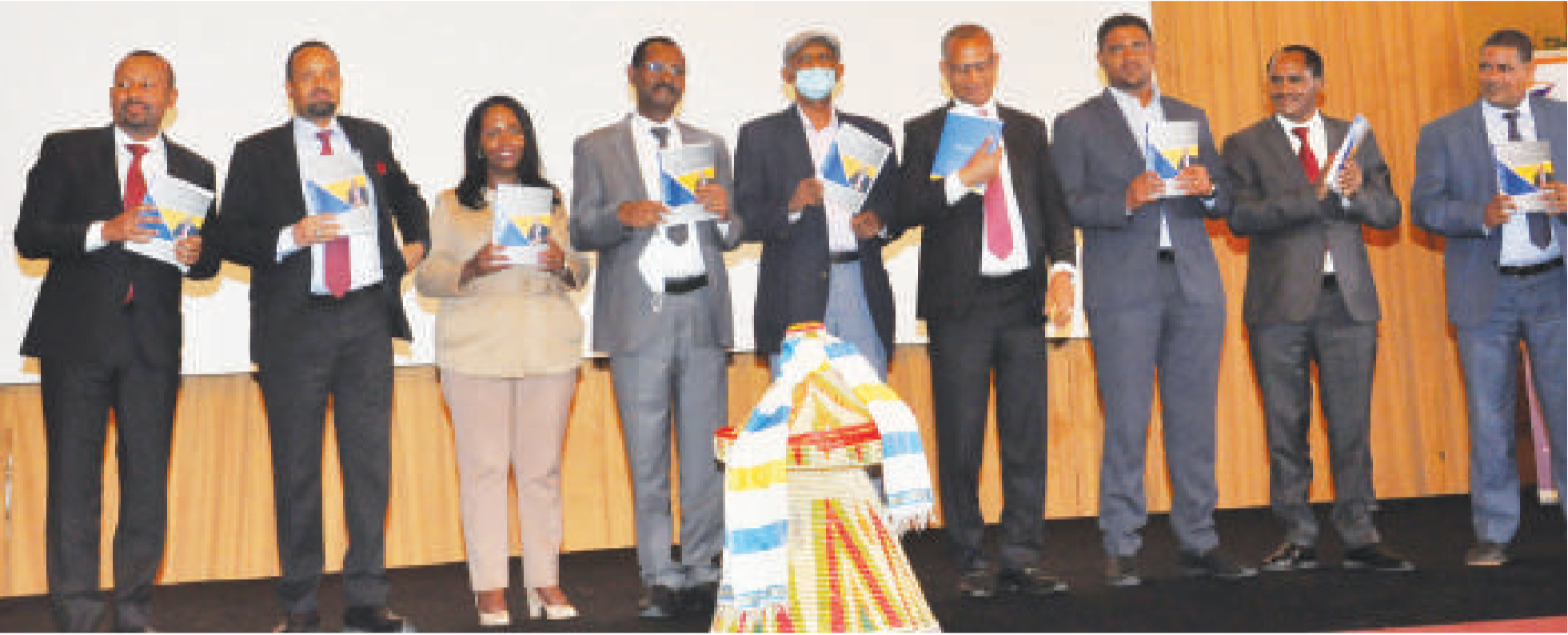
ፎቶ - ገበየ ገበየ