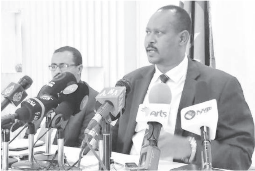
ኣብ ክልል ትግራይ ኣብዚ ኹዚ እዋን 4ኛጥቢ 5 ሚያዳን ዜጋታት ሰብአዊ ሓገዝ የድልዮም እዩ፤ ንዚኣም ዜጋታት ዕለታዊ ሓገዝን ንዘለቑታ ንምጥያሽ መንግስቲ ምስ መዳርግቲ ዝኾኑ ትካላት ብምትሕብባር እናሰርሐ ይርከቡ

ከም መልዕኢ ኣብ መቐለ ዓብይ መፅለሊ ጣብያ እናተሰርሐ ይርከቡ። ንዝተመዘበሉን ንፀገም ንዝተቐልፀው ዜጋታት ኣቕርቦት ሓገዝ ካብ ምሃብ ንላዕሊ ኻለኣትኹረት ዝተውሃቦ ጉዳይ መሰረታዊ ናብርኣም ንምስትኽኻል እዩ። ሙሉእ ብሙሉእ ሰላም ኣብ ዝተረጋገፀሎም ቦታታት ተመዘበልቲ ናብ መረባቶም ክምለሱ እዮም ተባሂሎም እዮም። ዜጋታት ብድልዮት ዝምለሱሎም ሰለስተ መገዲ እውን ተፈልዮም እዮም። ተመዘበልቲ ካብ