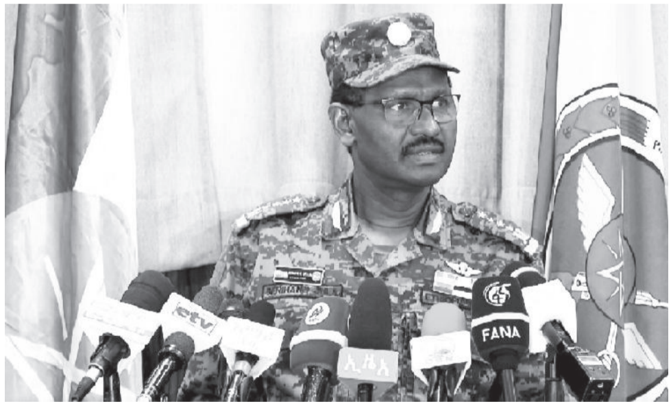
ሓደ እንትንኸውን እንምነይ ኢትዮጵያ ምፍጣር ንክእል ኢና፤ ሃፍትና ምጥቃም ንክእል ኢና፤ ሚኢትን ዓሰርተን ሚያዳን ህዝቢ ምምጋብ ንክእል ኢና፤ ሓደ እንትንኸውን ንክበር ኢና፤ ሓደ እንትንኸውን ዓበይቲ ንኸውን ኢና፤ ተዘይኾይና ግና ተበታቲና ኣደዳ ፀላኢ ካብ ምዃን ኣይንድሕንን

ሓይሊ ፀጥታ ሓዘ ፀላኢቲ ፈልዮ ብምርኣይ ካብ ወጻኢን ውሽጥን ዝኸበሩ ፀላኢ ዝወፀሉ ትልሚ ኣፍሪሶ ምስ ምክልኻል ሰራዊት ብምዃን ክከላኸል ኣለዎ።