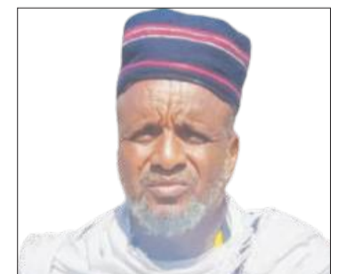
Abbaa Gadaa Aliyyii Mahammad