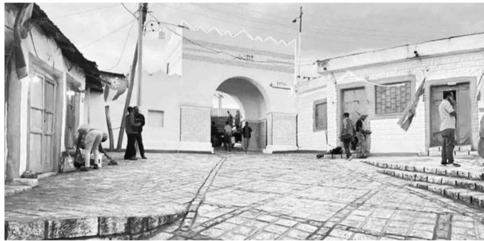
Seensa Shawaa Barrii Zagaah Uggaa