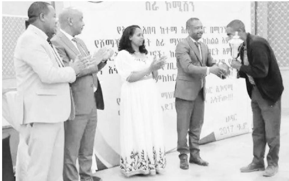
Yuniyeniin Hojii Gamtaa Qonnaan Bultootaa Liiban wayita badhaafamutti

Yuniyenichi aanaalee kunneen keessaa waldaalee hojii gamtaa bu'uuraa 120 qaba. Yuniyenichi yeroo ammaa guddina sadarkaa gaariirra jira. Pirojektotni hojjetaman baay'eenis barana hojjiitti galaniiru. Warshaan qindeessa nyaata beelladootaafi horsiisni loowwan aannanii pirojektota