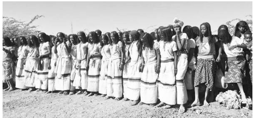
Hirmaattota sirnichaa keessaa