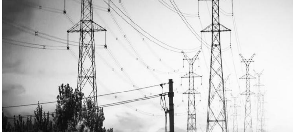
Hidha Laga Abbayyaa humna elektirikaa maddisiisaa jiru

Kun akka milkaa’uuf hidhi Laga Abbayyaa shooraa olaanaa qabaachuu himanii; fedhii humna elektirikii biyya keessaaf barbaachisu guutuudhaan gama biroon ammoo biyyoota olla walitti hidhuun akka danda’amu agarsiisaa jira. Kanarra darbee biyyoota gama hundaan walittifiduu qajeeltoo mootummaa Itoophiyaa biyyoota olla “Kennanii fudhachuu” dhugoomsuu keessatti shooraa olaanaa taphachaa