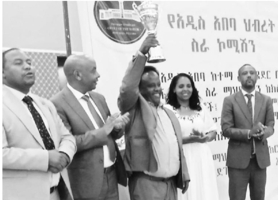
Warshaan Daakuu Waangaarii wayita badhaafamutti

Warshichi guyyaatti daakuu boqqolloo toonii 50fi daakuu qamadii toonii 50 waliigalatti daakuu toonii 100 qulqullina sadarkaasaa eegeen omishaa jiraachuu himanii, omisha dhiyeessu kanaafis walitti hidhamsiinsa gaarii qaba. Warshichi gara fuulduraatti omishasaa gara biyya alaatti