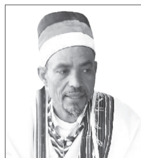
Abbaa Gadaa Warqinaa Tarreessaa