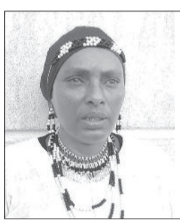
Suruur Haadha Siinqee Tigisti Dibaabaa