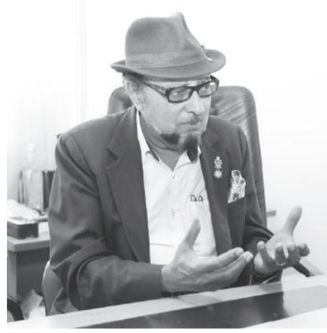
Doktar Qosxeenxinoos Barihetesfaa

Misoomni koriidarii federaalaa hanga naannoleetti diriire yeroo turtii keessummootee dabaluufts ta'e carraa investimantii daawwachiisuuf gooda guddaa waan qabuuf qindoominaan hojjechuun murteessaadha. Hundaa ol, Daandiin Humna Qilleensaa