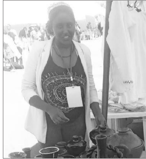
Aadde Geexee Fiqree

Akka Aadde Geexeen jedhanitti, dur suphee dhahuun akka hojii tuffatamaatti ilaalama. Ilaalchi hojii tuffachuufi filachuu cabuu