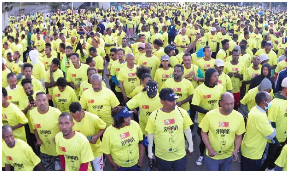
Hirmaattota fiigicha guddicha keessaa

Kaayyoon isaa dorgommii gaggeessuu qofa osoo hintaane dhaabbilee arjoomtota