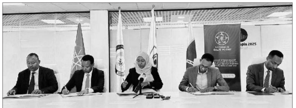
Hoggantoonni sektaroota shananii wayita sanada waliigaltichaa mallatteessanitti

Misoomni koriidarii kun kutaa magaalaa 3'n, aanaalee 10 kan hammatu ta'uus Aade Zahaaraan kaasanii, milkaa'ina hojichaatiifis deeggarsi hawaasaafi qaamolee dhimmamtootaa cimee akka ittifufuu waamicha dhiheessu.