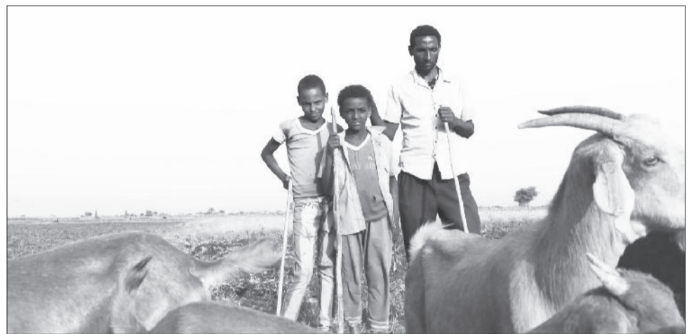
Qabeenya beeyiladaa Itoophiyaan qabdu keessaa

horsiisa beeyiladootarratti dhiibbaa uuman biroo ta'uu kaasuu.