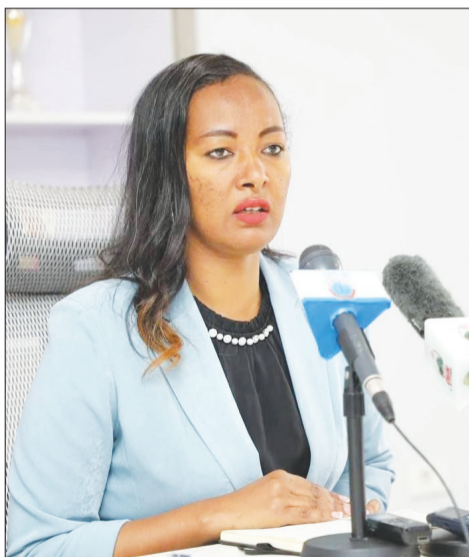
Aadde Mabraat Baacaa

Oromiyaatti dhiibbaa daa'immaniifi dubartootaa qolachuuf sosochiin hubannoo ji'a tokkoof turu har'a eegala