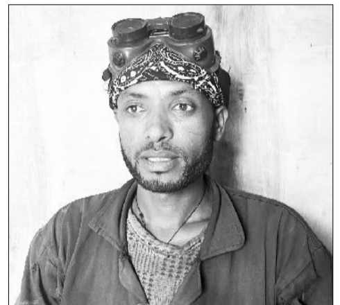
Dargaggoo Guutaa Waaqshuun

qoosnaan yeroon bor namatti qoosa waan ta'eeef dargaggoonni yeroofi humnasaaniitti sirnaan fayyadamuu qabu. Hojiin dhibee utuu hintaane hojii filachuufi tuffachuutu jira. Namni tokko olba'ee jiraachuuf gadbu'ee hojjechuu qaba. Dargaggoonni ilaalcha hojii tuffachuufi filachuu keessaa ba'uu akka qaban yaadachiiseera.