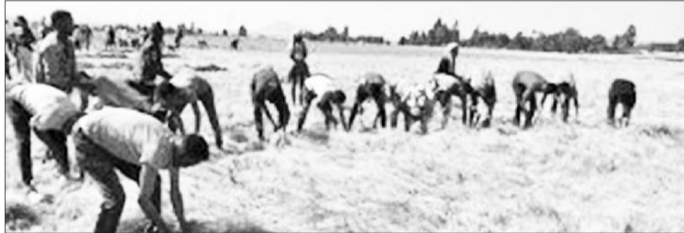
Wayita omishni haamamu

Waggoottan kurnan dhufanitti beela addunyaarraa balleessuuf doolarii Ameerikaa biliyoona 50 kan barbaachisu ta'uu himanii; dhaabbileen deeggartoota idil addunyaafi qooda fudhattootni hundi gahee isaaniirraa eegamu bahachuu qabu jedhaniiru. Keessattuu biyyootni guddatan imala beela balleessuuf taasifamu keessatti waadaa kanaan dura galan hojiitti hiikuu akka qabanis hubachiisaniiru.