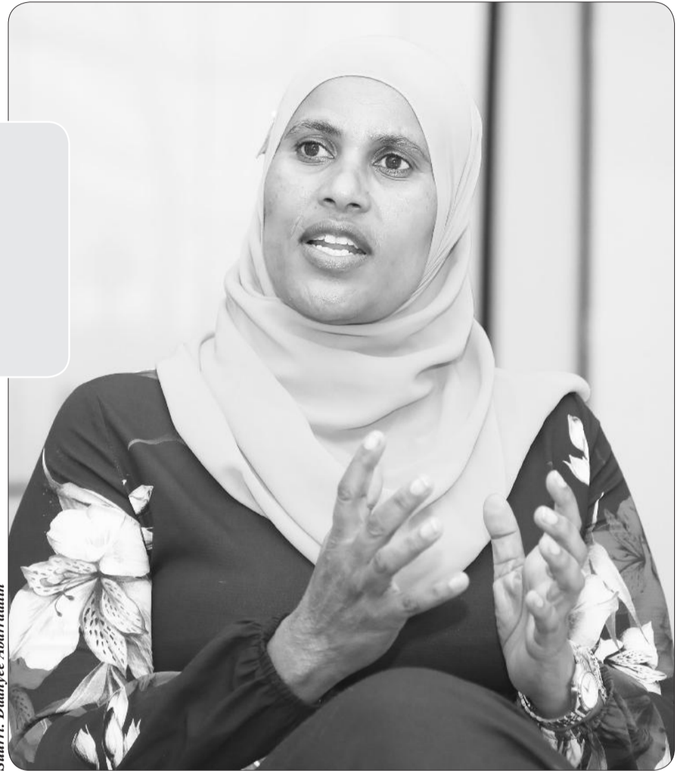
Suurri: Daanyee Abarratiin

Akkaataa kanaan bara kana qarshii biliyoona 65, kurmaana tokkoffaatti immoo biliyoona 14 sassaabuuf karoofannee, gara qarshii biliyoona 13.4 (% 96) sassaabuun danda’ameera. Kun galii magaalooni maddisiisan yeroodhaa gara yerootti dabalaa jiraachuusaa agarsiisa. Galiin magaaloota guddate jechuun ammoo fedhii bu’uuraalee misoomaa jiraattoota magaalaa deebisuu keessatti gahee mataasaa qaba. Kun ammoo carraa turizimii harkisuu, hojii uumuu, investimantii harkisuufi kanneen biroo qaba. Gama kanaan hojii jajjabeessaan hojjetamuu qoranneerra. Kanaan walqabatee