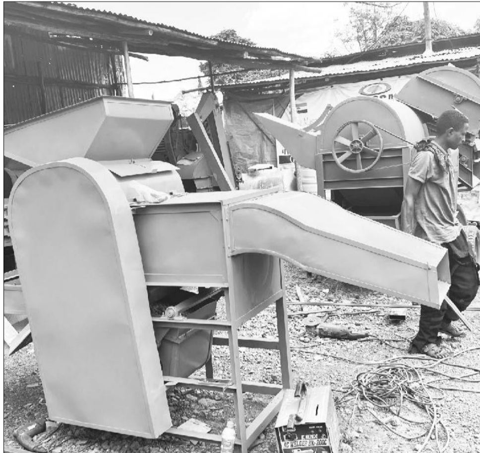
Maashinoota waldichi omishu keessaa