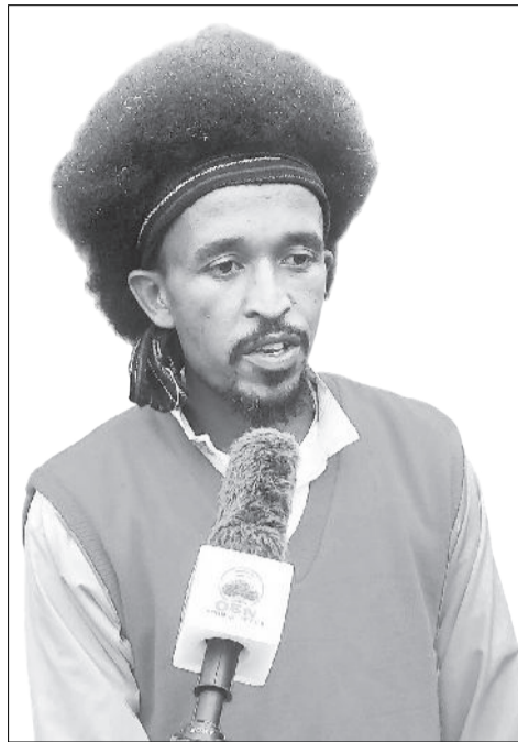
Dargagoo Araarsaa Margaa

Tibbana ayyaana Irreechaa Malkaa Ateete Buraayyuu Gafarsaatti kabajamerratti dargaggoota uffata aadaatiin miidhaganii birraa fakkaatanii naannawaa malkaa fi magaalota bareechan sirbaa dhiichisaa warreen gammachuu dhandhaman