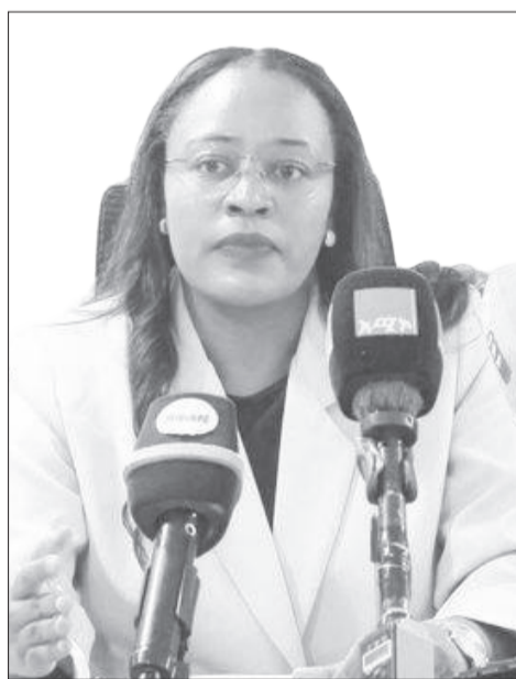
Aade Shawwit Shaankaa

Biyyoonni kunneen yeroo yeroon marii taasisuun guddina ispoortii kubbaa miilaaf carraaqaa turaniiru; ammas carraaqaa jiru.