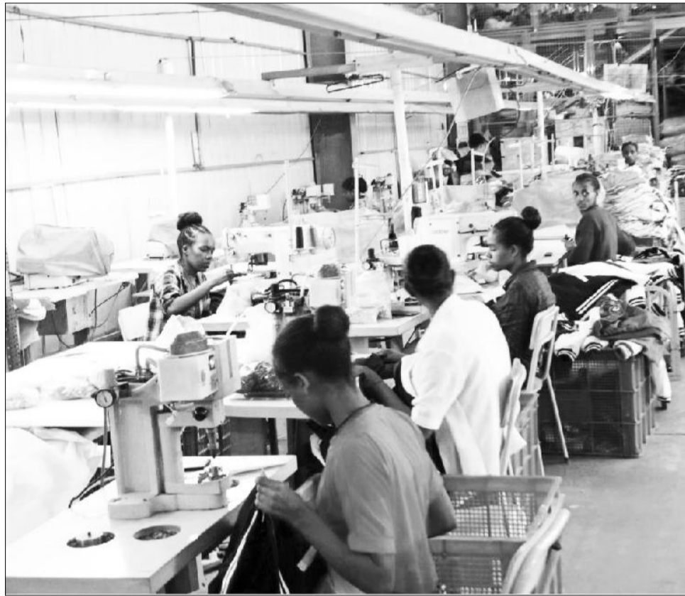
Lammiilee zoonichatti carraa hojii argatan keessaa

Komishinarri Ittaanaan Komishinichaa Doktor Zallaqaa Tamasgeen sagantaa daawwannaa Zoonii Indastirii Istarnii torban darbe taasifamerratti akka jedhanitti, riifoormii taasifameen walqabatee bakka investimantii mijataa uumuuf fooyyessiiwwan seeraa, dinagdeefi