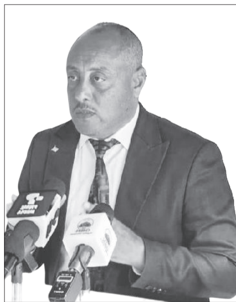
Obo Geetuu Gammachuu

Lafa waliigalaa omishaalee gara garaatiin uwwifame keessaa lafa heektaara miliyoona saddeetiifi kuma 651 (%78) kilaastaraan qotuu danda'ameera. Lafa waliigalaa midhaanota akaakuuwwan gara garaan uwwifame keessaa lafa heektaara miliyoona 4.8 (%43) ammoo tiraaktaraan qotameera. Kun qonni naannichaa gara teknolajii qonnaa fayyadamuutti ce'aa jiraachuu agarsiisa. Lafa waliigalaa bara omishaa 2016/17 midhaanota gara garaan uwwifamerra omisha kuntaala miliyoona kuma 337 sassaabuuf