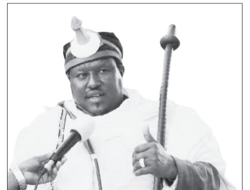
Abbaa Gadaa Kuraa Jaarsoo

Bu'uuruma kanaan Gadaa Booranaa 71ffaan sagantaa qophii baallii kennuufi jiloota garagaraatiif yaamicha taasisuun yeroo ammaa sagantaa qophii baallii kennuu geggeeffamaa jiruun hanga ammaatti jiloota aadaa gurgura naqaa geggeessuun xumuranii jila Odaa Buuluutiif Godina Boorana Bahaa, Aanaa Arerootti Yaa'i Hawaxxuu Ardaa Jilaa Bulee Harsoogidootti, Yaa'i Koonnituu Ardaa Jilaa Dhaddacha Dambala buleetti, Yaa'i Harbooraafi Qaalluun Odituu Ardaalee Guutoofi Dureettiitti galma dhaabuun