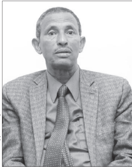
Suurri : Iyyoob Tafariitiin

Bariisaa: Itoophiyaan carraa waancicha qopheessuu yoo argatte bu’uraalee misoomaa taphichaaf barbaachisan guuttattee akkamiin milkeessuu dandeessi?