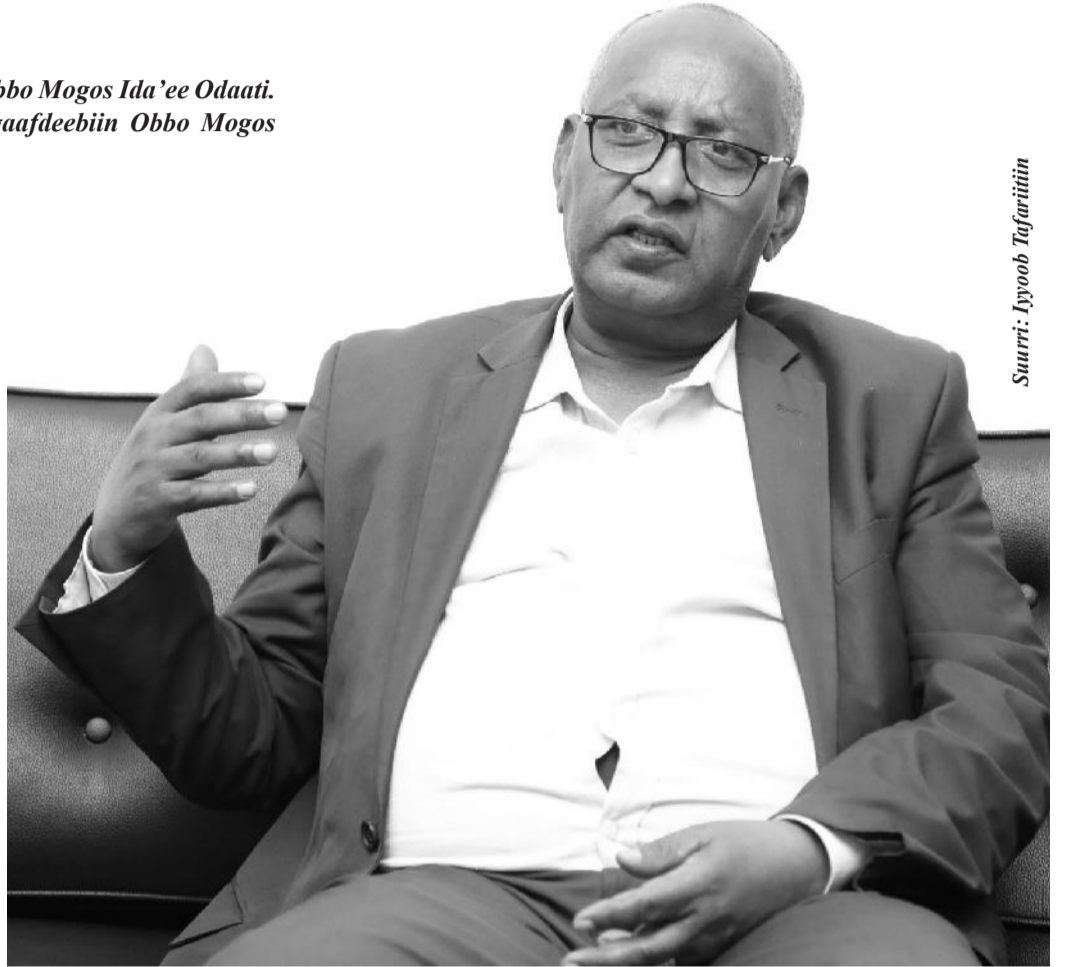
Suurri: Iyyoob Tufuritiin

Sagantaan nyaata barattoota kun barattoonni barnootasaaniitti akka cimaniifi hanqina nyaataa isaan mudatu furuu keessatti gumaacha olaanaa taasisaa jira.