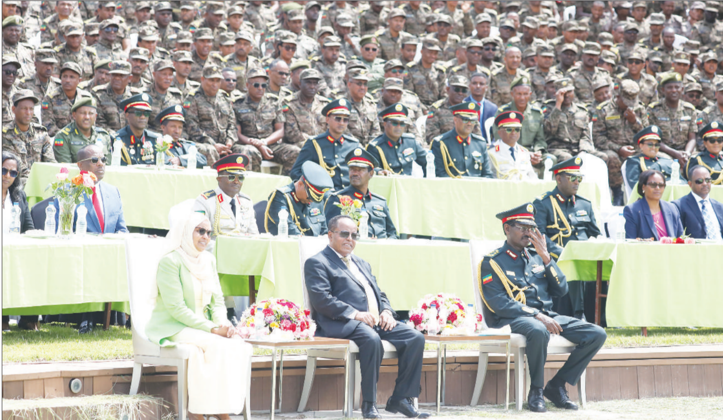
Suurri: Daanyee Abarraatiin