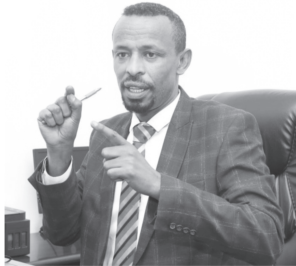
Suuri: Daanyee Abarraatiin

Karaa biraas barri haaraan walaaansoo matasaa danda’e fidee dhufa. Jireenya kaleessa keessa turre keessaa ba’uuniyyuu