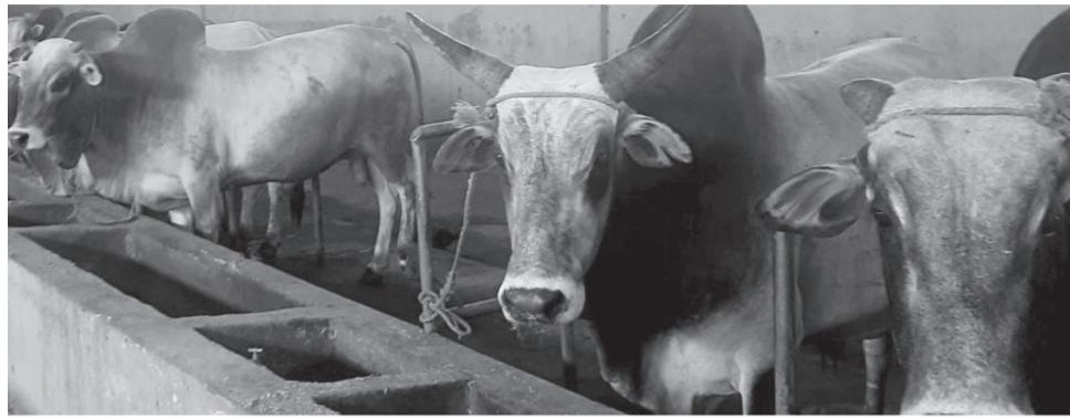
Finfinneetti omisha Giddugala Horsiisa Beeyiladaa naannawa Koyyee Faceetti argamu

Gaba ayyaanaa bara haaraa (2107) sababa godhachuun qaala'iinsi gatii akka hinuumanneef