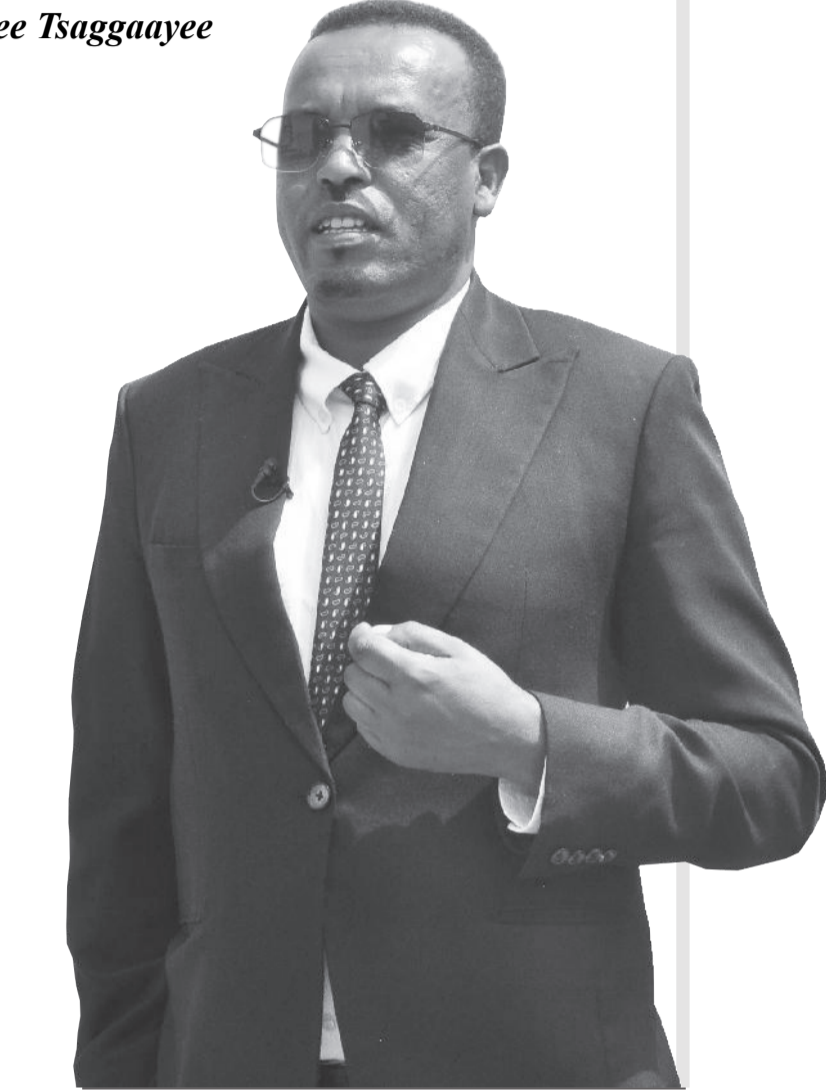
Suurri: Gabbaaboo Gabreetiin

booda xiyyeeffannoo kennuufin hordoffiifi deeggarsa walirraa hincinne gochuun yeroo qabame, bajata ramadameefi qulqullinaan akka xumuraman gochaa jirra.