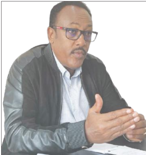
Komishinara Ittaanaa Malaakuu Faantaa