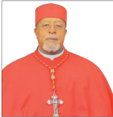
Kaardinaal Birhaanayesuus Surafeel