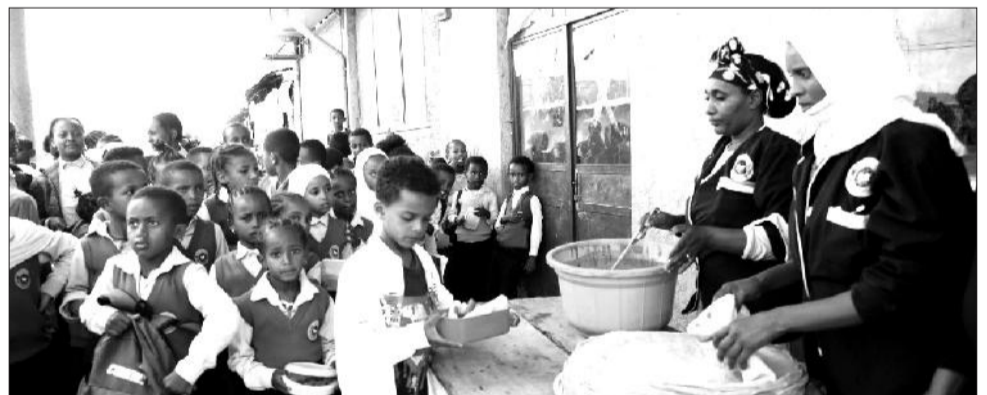
Barattootaaf nyaata dhiyeessuunis qaamuma misooma barnootaati

Karoorra bara bajataa 2017 ilaalchisee Obbo Efreem akka jedhanitti, Manneen Barnootaa Bu'uura Boruu 5,000, sadarkaa tokkoffaa 1,000, mana jireenya barsiisotaa 8,000 ol ijaaruu karoofameera. Haaluma walfakkaatuun Manneen Barnootaa Bu'uura Boruu 3,170, sadarkaa tokkoffaa 2,764, Sadarkaa lammaffaa 184, Manneen Barnoota