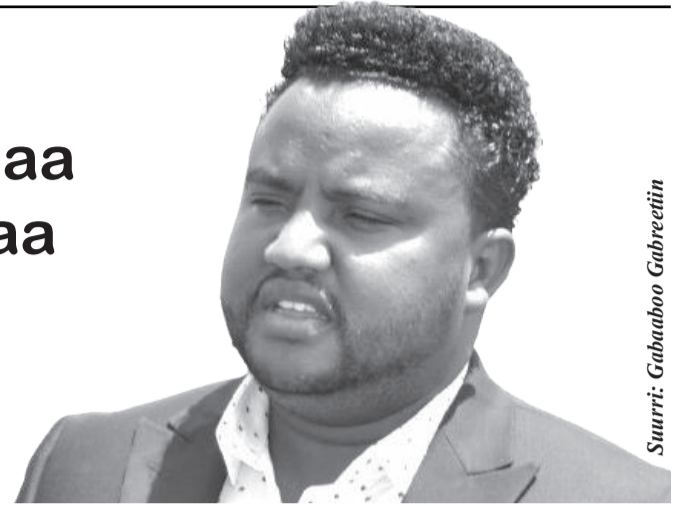
Suurri: Gabaaboo Gabreetiin