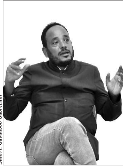
Stuurri: Gabaraboo Gibreetiin

Murtii kennuudhaan dura guungumatu jira. Guunguma jechuun yeroo abbaan murtii murtii kennuuf deemutti namni murtiin itti deemamaa jiru waan garaa isa nyaatu dubbatee baafachuu jechuudha. Namni guunguma qabu “Sitti guungumame! Dhimma kana seera aadaa kamiin ilaalte?” jedhee yoo waanti dabe ykn ifa isaaf hintaane jiraate ni guunguma. Yoo guungumni