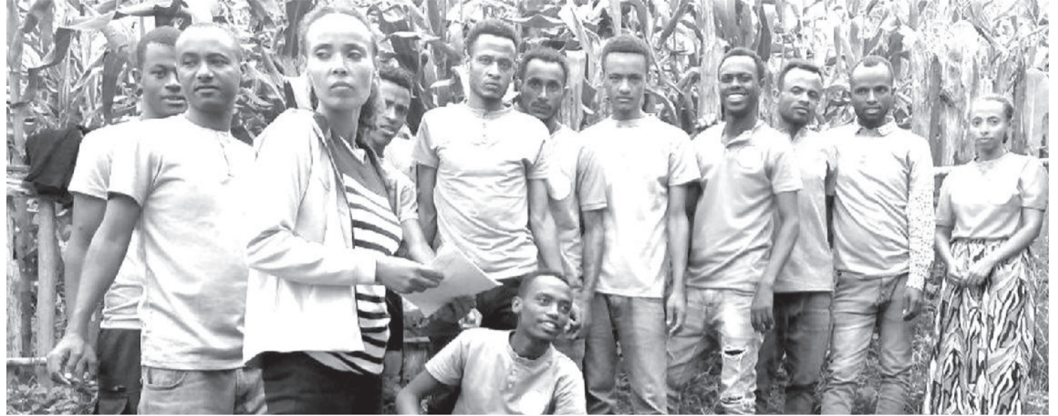
Dargagoota Alataa Wandootti hojii tola ooltummaarratti hirmaatan keessaa