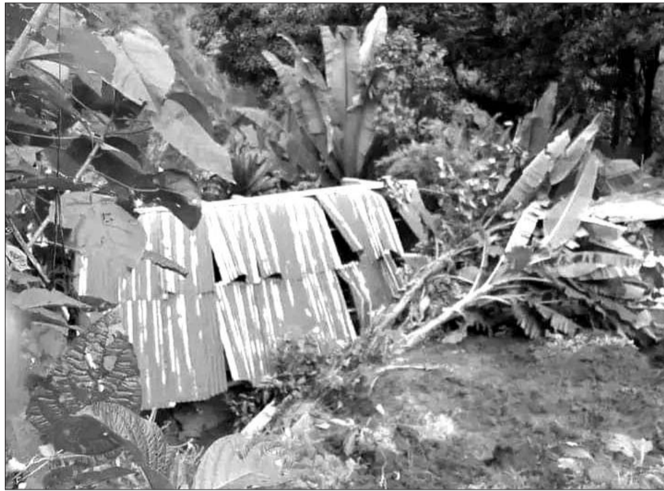
Tibba gannaa kana iddoowwan adda addaatti waan sigigni lafaa mudachuu maluuf of eeggannoo gochuun barbaachisaadha

Ta'us barattoota waraqa qorannoo qopheessan fayyadamuudhaan daandiiwwan hojjetaman tokko tokko hordofuun qorannoo balaa sigiga taasisaa jira. Hanga ammaatti qorannoo taasisaan bakkeewwan balaa sigigaaf yaaddoo hinqabneefi qaban muraasa adda baasuun danda'ameera. Daandii Walisorraa Wancii geessu akkasumas naannawaa haroo Wancii dabalatee sigiga mudachuu akka malu bu'aan qorannoo yunivarsitichi barattoota waliin ta'uun gaggeesse mul'iseera. Kanaaf, naannawaa kunneenitti xiyyeffannaan