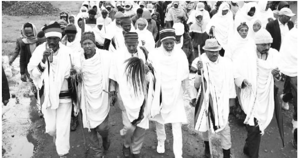
Waamichi ummichaa owwaanaa argachuu qaba