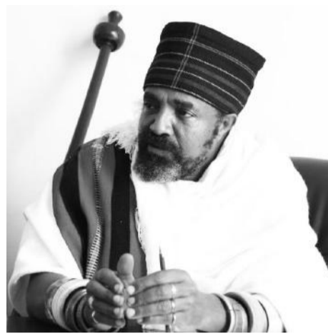
Abbaa Gadaa Goobana Hoolaa

Barreessaa Gumii Abbootii Gadaafi Abbaan Gadaa Tuulamaa, Goobana Hoolaa akka jedhanitti, gargaaramtummaan kabajaafi birmadummaa biyyaatti bu'a waan ta'eef gargaaramtummaa jalaa ba'uuf jabaannee hojjennee omishaafi omishtummaa keenya