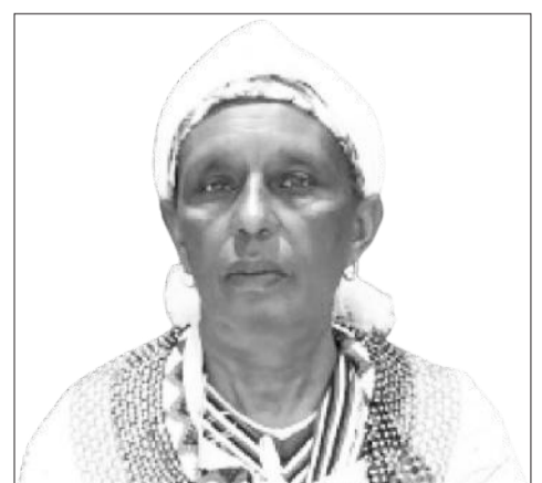
Haadha Siinqee Kabaa Bayyanaa