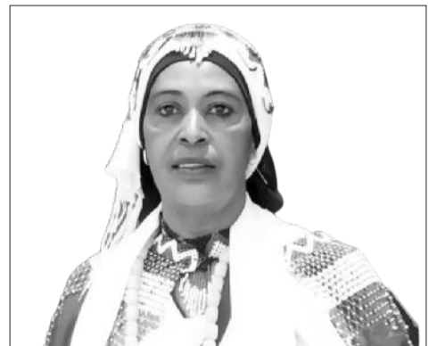
Haadha Siinqee Qamariyaa Ahimad