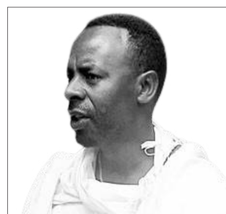
Dargaggoo Buzunaa Duuloo

ijaarsa sirna dimookiraasii keessatti ga'eesaanii ba'uun anniisaa jijjiiramaa akka ta'aniif sadarkaa aanaafi gandaatti hojiin