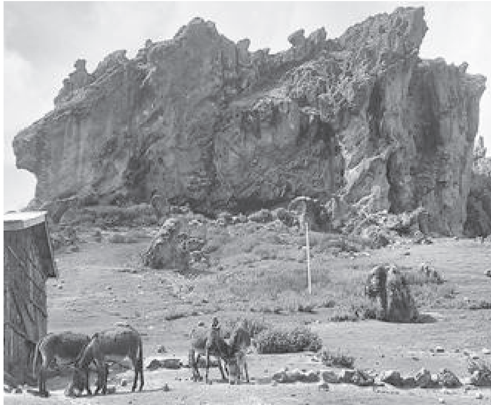
Holqa Sabsibee Diinshoo

Ijaarsi daandii Baalee naannawa Holqa Sabsibee (Gaara Waadudubbatoo) yeroo dheeraaf deebii dhabuurraa kan ka'e balaa konkolaataa mudatuun lubbuun dhala namaa