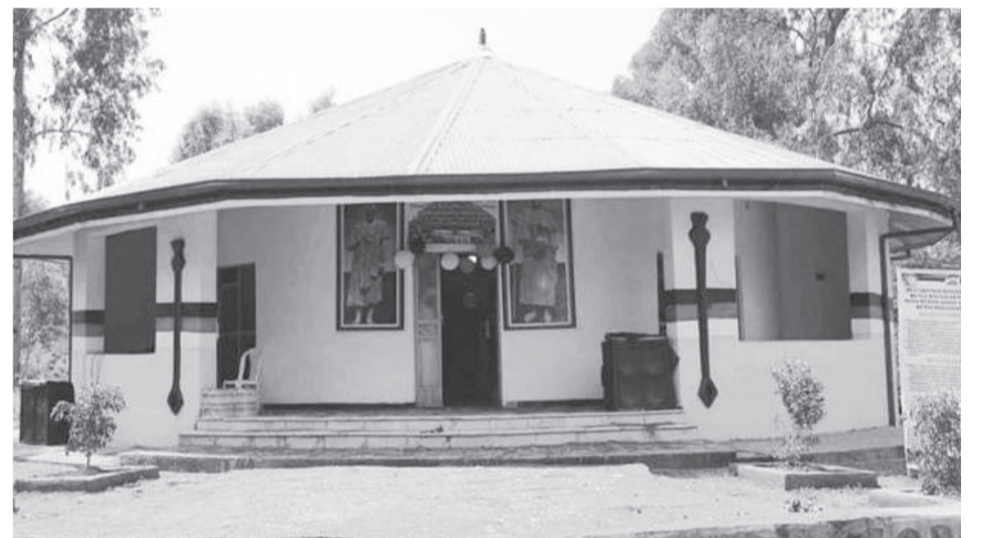
Manneen murtii aadaa Oromiyaatti ijaaramanii eebbifamaa jiran keessaa

Isaan akka aadaa abboota isaaniirraa dhaalanitti duudhaa ganamaatiin lubbuu cooqa buute cooqa kaasuu, kan wallole