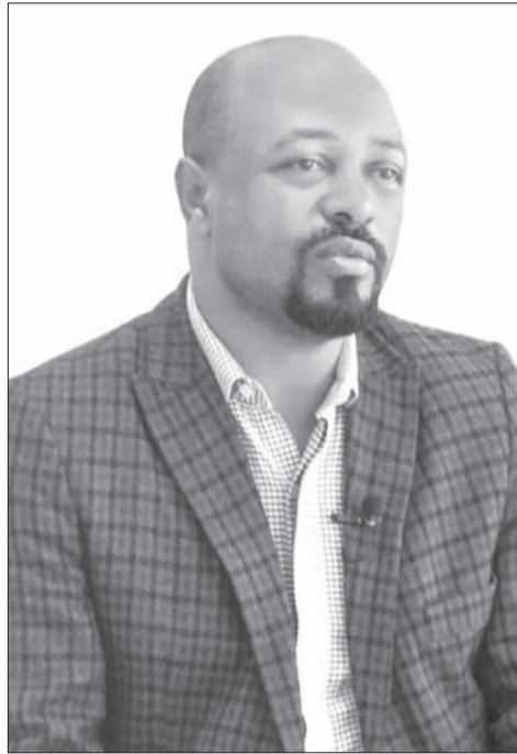
Obbo Didhaa Guddataa