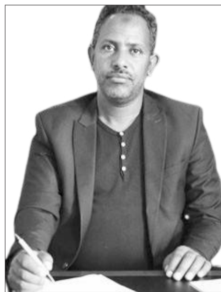
Komishinara Ittaanaa Faaruq Jamaal

Dabalataanis, baay'inni fayyadamtoota qonna magaalaa akka dabaluu fayyadamtootni fayyadamaa jiran kuma 456fi 650 ittifufsiisuun danda'amu himanii; isaan keessaa namootni kuma