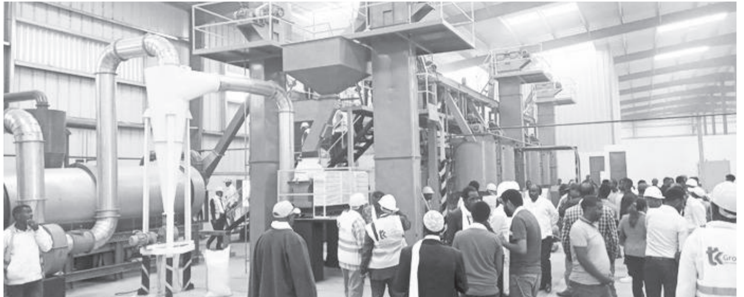
Paarkii Industirii Qonna Qindaa'aa Bulbulaa

Paarkii Industirii Qonna Qindaa'aa Bulbulaa zoonii omishaa adda addaa ja'a kan qabu ta'uu himanii, yeroo ammaa omishaaleen gara garaa 11 paarkichatti omishamaa jiru. Paarkicha keessa pirojektotni 55 jiraachuufi kunneen keessaa warreen omisha jalqaban; maashinoota dhaabaa, sheedii ijaaraafi maashinoota alaa