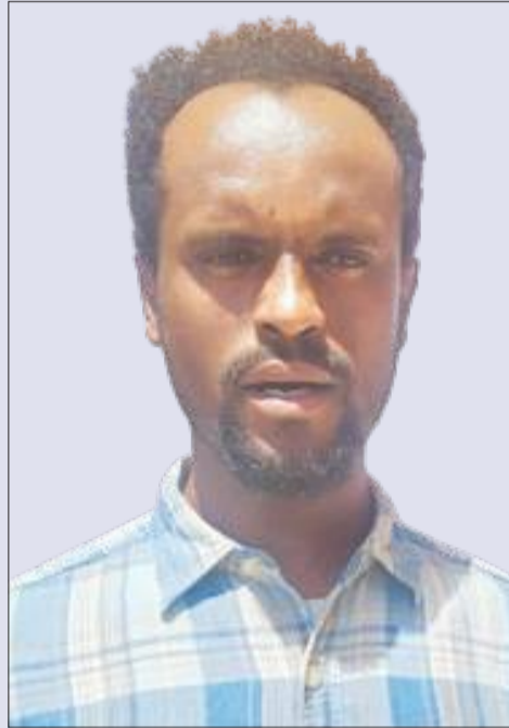
Obbo Taaddalaa Immiruu

Qorannoo kanaan dura gama kanaan Ahariin gaggeessaa tureen bookeen busaa haaraa keemikaala dur tureen du'uu akka hindandeenye mirkaneeesera. Kanaafuu bookee busaa Anoofiles Isteefensaay jedhamtu, kan waggaa waggaa