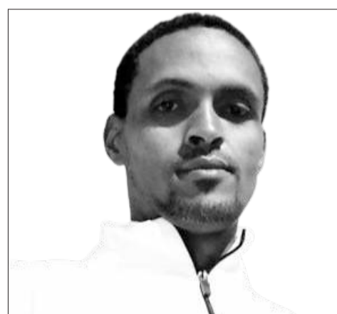
Dargaggoo Fedhasaa Dastaa

ijaarsa sirna dimookiraasii keessatti ga'eesaanii ba'uun anniisaa jijjiiramaa akka ta'aniif sadarkaa aanaafi gandaatti hojiin