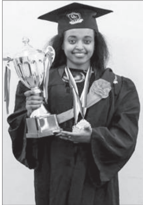
Barattuu Gaaddisee Ittafaa

Barattuu Gaaddiseen maatii qonnaan bulaa harkaqaal’eeyyii keessaa waan dhalateef akka maatiittis ta’ee biyyaatti hayyuu dinagdee ta’uun wantoota jireenya qonnaan bulaa fooyyessan rogawwan maraan