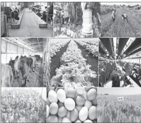
Bu'aalee qonna magaalaa keessaa

83fi 731fayyadamoo bu'aa beeyiladaa ta'uu ibsaniiru.