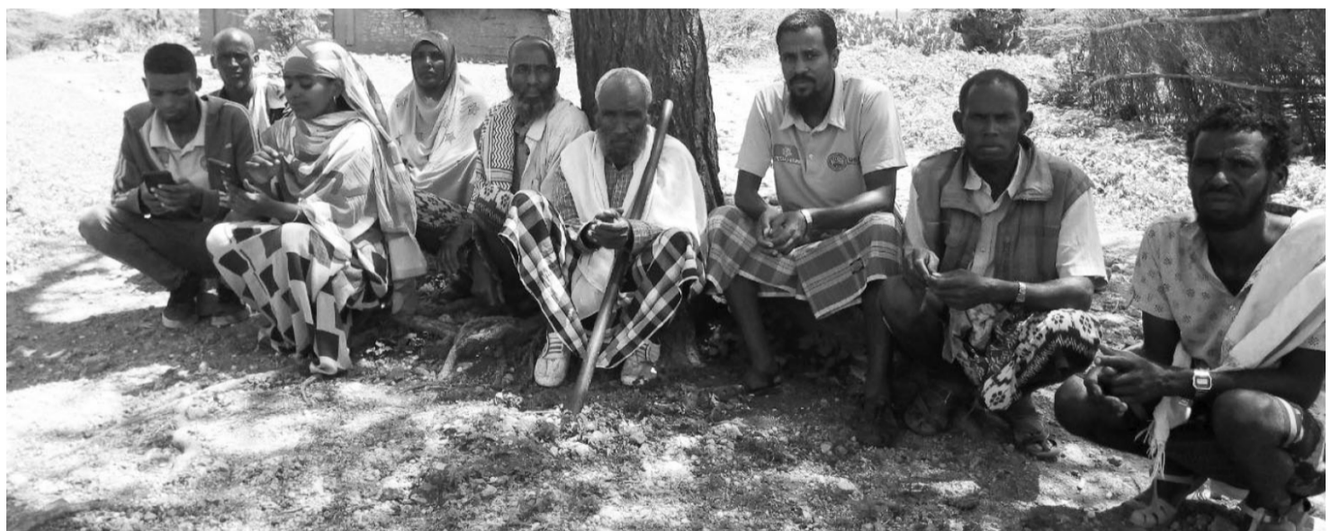
Maanguddoonni haala ilaalanii milkii gaarii ta'uufi kaan raagu

'Manaazilli' jechuunis jecha Afaan arabaa yemmuu ta'u, Afaan Oromootiin yoo hiikamu waqtii sanyiin keessatti tolu kan iddoo duraan ture irraa jijjiiramu jechuudha.