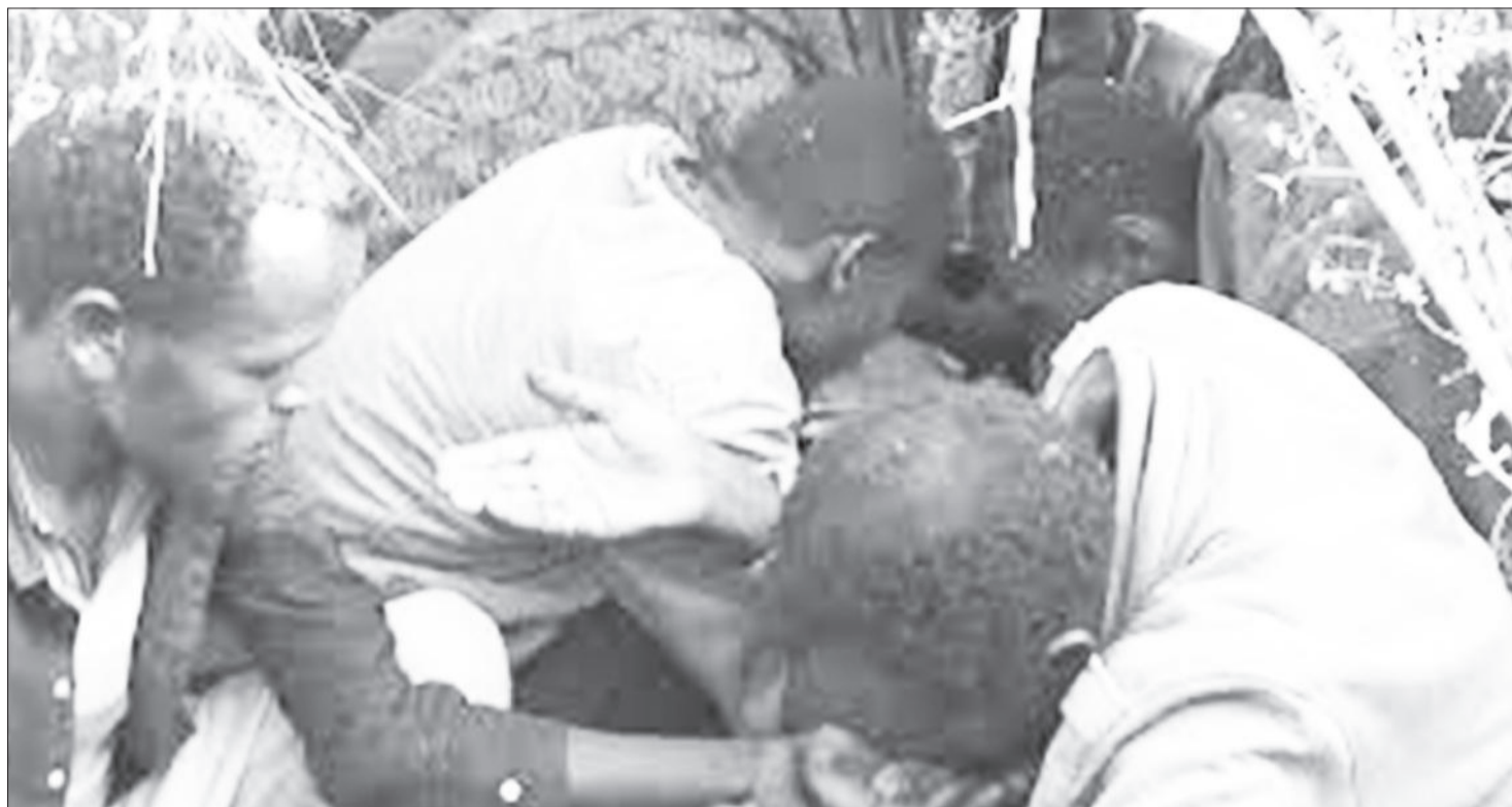
Yeroo sirni gumaa raawwatamu

Namichi nama ajjeese sun immoo mana sirreessaa akka galu taasifama. Mana sirreessaa kan hingalle yoo ta'e ammoo firootasaa fagoo jiraatan biratti baqatee