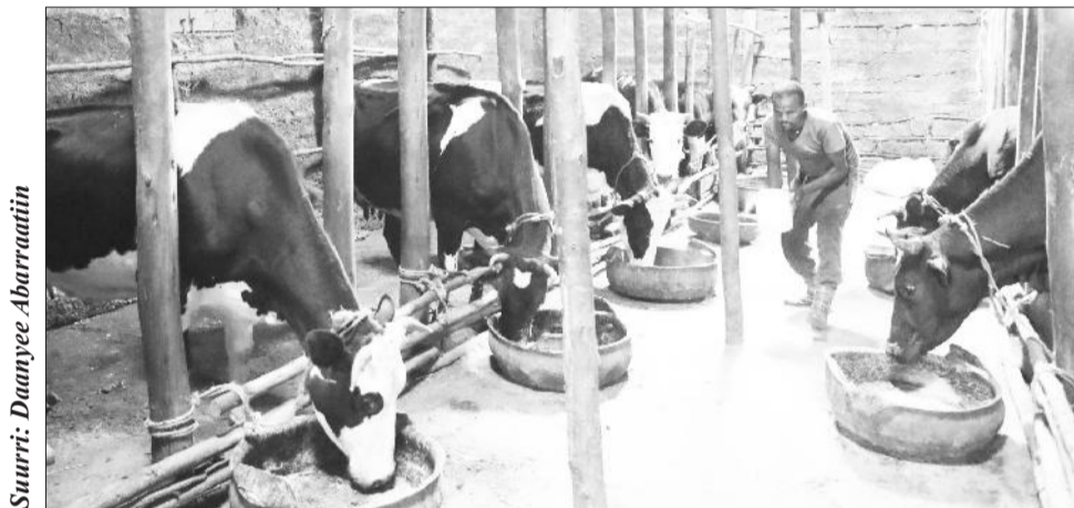
Suurri: Daanyee Abarraatiin

Magaalattiitti loowwan aannanii bal'inaan horsiifamaa waan jiraniif gara fuulduraatti gaba'a aannaniirratti sodaa qabna. Rakkoo gama kanaan mudachuu malu furuudhaaf warshaan aannan qindeessu utuu ijaaramee