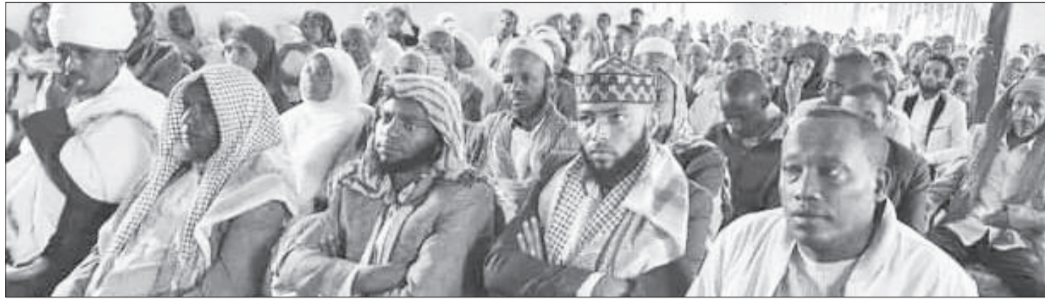
Hirmaattota leenjichaa keessaa