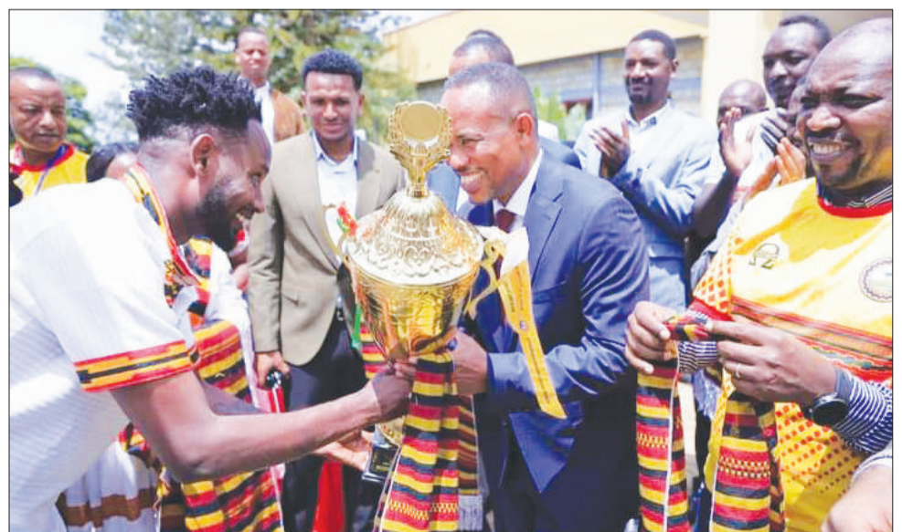
Abbaa waancaa kan ta'e kilaba Arbaaminci

deebi'u pirezidaantiin naannoo Kibbaa Obbo Xilaahuun Kabbadaa magaalaa walaayittaa Sooddootti argamuun kilabichaaf simanaa godhaniiru. Wayituma kana kilabichaaf qarshii miiliyoona tokkofi Konkolaataa Awutoobiisii badhaasaniiru.