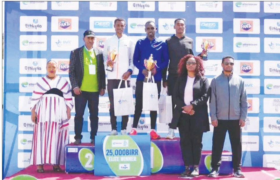
Ambaasaaddar Naasisee Caalii badhaafamtoota waliin

Faana saanii bu'uudhaan Ijigaayoo Dibaabaafi obbolaanshee Xirunash Dibaabaafi Ganzabee Dibaabaa akkasumas Gooticha Olompikii,