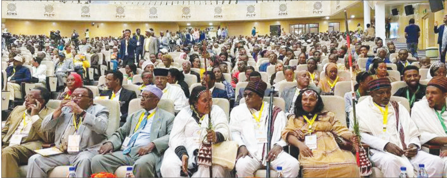
Jalqabbii ajandaa walitti qabuu Magaalaa Finfinneetti