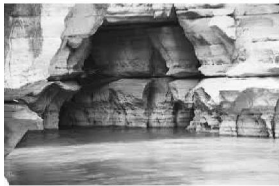
Bakkeewwan hawwata tuurizimii

Bakkeewwan hawwata tuurizimii aadaa, namtolcheefi uumamaa kutaalee biyyattii garaagaraatti baay'inaan mul'atanis beeksisuufi misoomsuu hanqinni guddaan waan jiruuf madda galiittii jijjiiruun hin danda'amne. Sababa rakkoo nageenyaa bakka tokko tokkotti mudatuufi hanqina hubannoo daawwachiftootaabis walqabatee kallattiin daawwannoo bakkeewwan muraasa qofa ta'uus manni marichaa qeeqera.