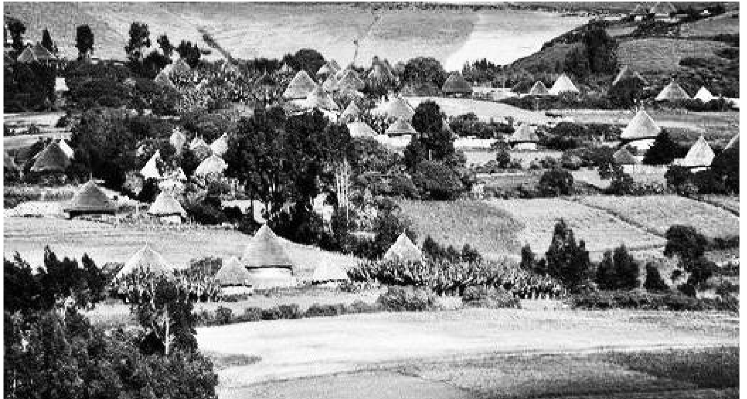
Labsichi bulchiinsaafi ittifayyadama lafa baadiyyaa ammayyeessuu keessatti gahee guddaa qaba

Yoo waljijjiirraan lafaa naannolee lama gidduutti raawwatame waliigaltichi barreeffamaan dhiyaatee qaama mootummaa federaalaatiin aangoon kenneeffiin mirkanaa'uufi galmaa'uu qaba. Abbaan qabiyyee lafaa seeraan akka hinbuqqane taasisa. Lafi qabiyyee waloo ta'e qaama seerummaa akka qabaatuuf sirni qabiyyee lafaa waloo waliin akka eegamuufi kunuufamu taasisu diriiru qaba.