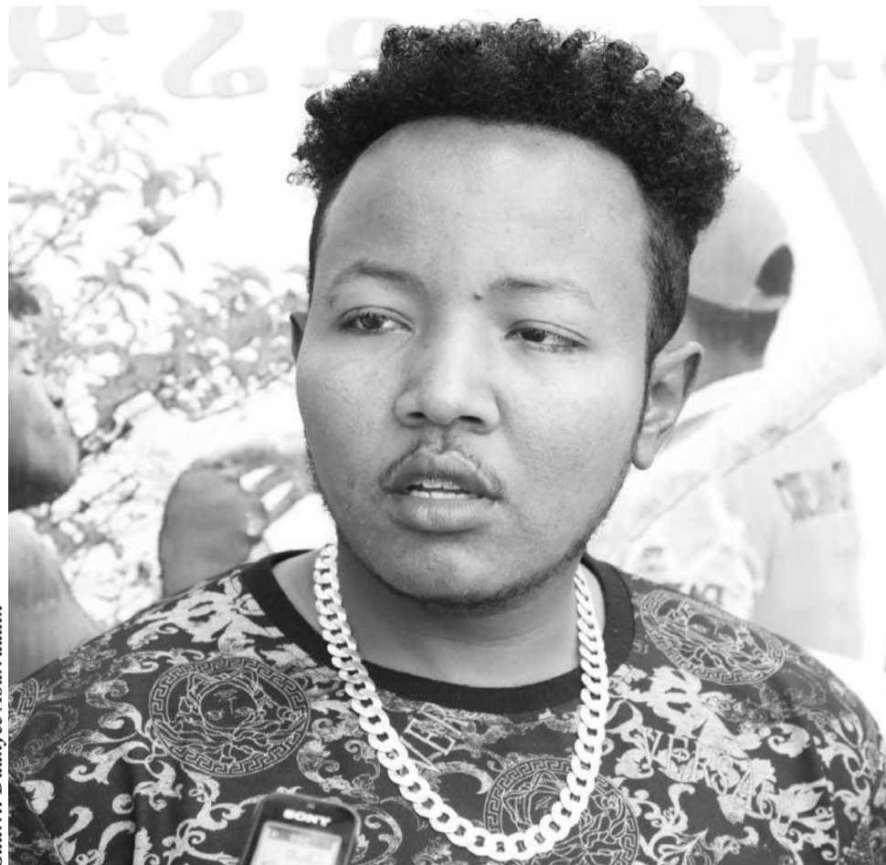
Suuri: Daanyee Abarraatiin

Humnis beekumsis nidhuma. Kanaan walqabatee yoo yeroo dargaggummaa keenyaatti dinagdeedhaan of hin ijaarre galgalli keenyas ta’e kan dhaloota nuduuba