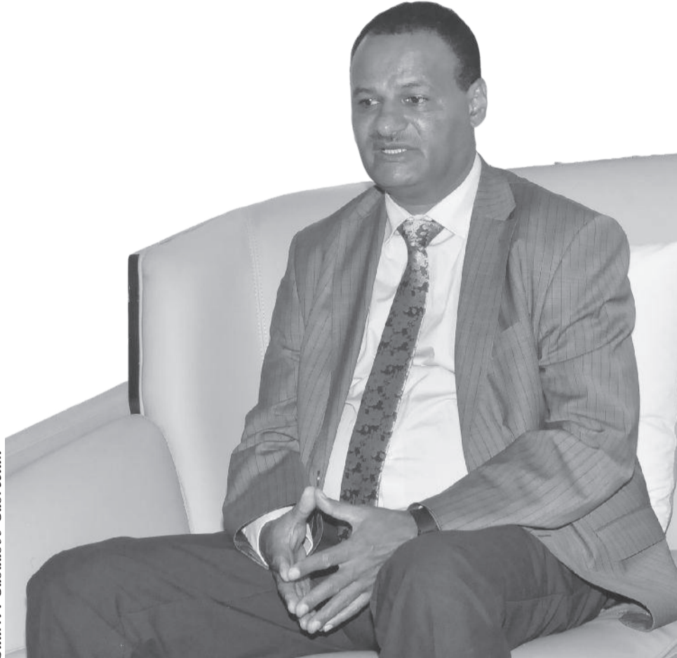
Suuri : Gabaaboo Gabreetiin

Akkuma beekamu barataan barnoota sadarkaa gadaanaa keessatti sirnaan hinqalbifanneefi dubbisuufi barreessuu hindandeenye gara sadarkaa giddugaleessaafi olaanaatti yemmuu guddatus waan daree keessatti barsiifamu