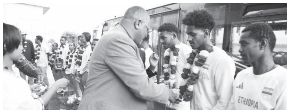
Wayita simannaan taasifametti