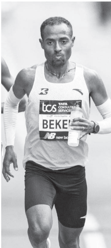
Atileet Qananiisaa Baqqalaa

Gootichi kun ammas biyya haadhasaa Itoophiyaa bakka bu'uuf miiniimaa Olompikii Paaris kan barana Faransaayitti adeemsifamuf dorgommii maaraatoni Landanitti taasifatetti umrii 41tti lammaffaa ba'uun ciminasa agarsiiseera. Kanaafuu Olompikii Paarisiiif atileetota Itoophiyaa bakka bu'uuf kaadhimaman keessaa tokko ta'uun galmaa'era.