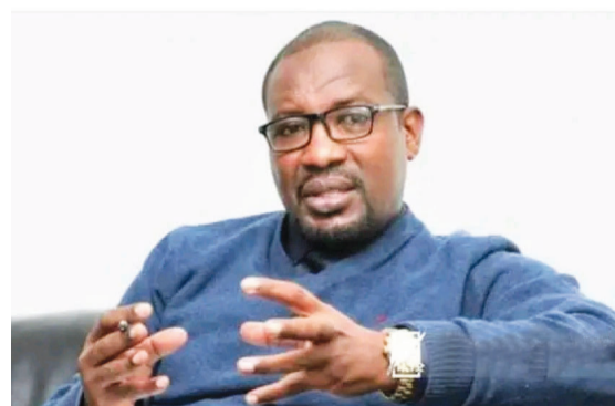
Luba Taagaay Taaddalaa