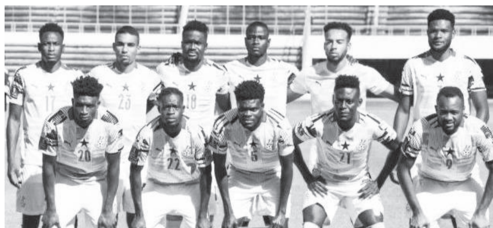
Garee Biyyaalessaa Gaanaa

Dargaggoota Afrikaa urjiwwan kilaboota biyyoota adda addaatti taphatan gaaddisa tokko jalatti walitti kan fide Wancaan Kubbaa Miilaa Afrikaa kun guyyaa guyyaadhaan sagantaan baheefi adeemsifamaa jira. Qopheessituu waancaa Kootdivaar dabalatee biyyoonni 24 ramaddii jahatti qoodamuun hirmaachaa kan jiran yoo ta'u, hanga kaleessatti taphoonni 15 taasifamaniiru. Walmorkiiwwan hanga ammaatti adeemsifaman kanatti