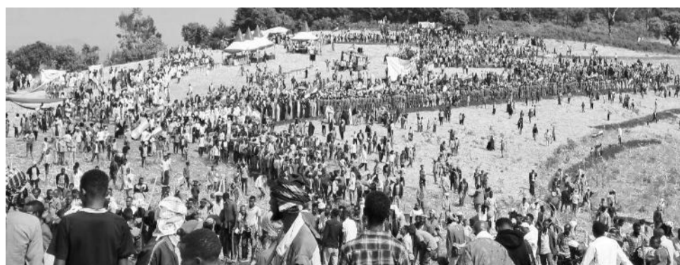
Hojii misooma sululaa godina Jimmaatti eegalame