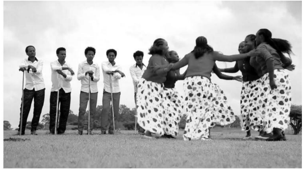
Ayyaana cuuphaa waltajjii aadaan ummataa itti calaqqisu