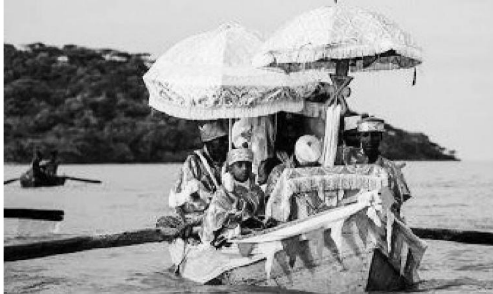
Haala kabaja ayyaanichaa kan bara darbee

Naannawaa ayyaanichi itti kabajamus turistootaafi hawaasa ayyaanicha kabajanif