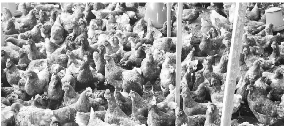
Horsiisni lukkuu hojiilee qonna magaalaa keessaa tokko

duraan baadiyyaatti qofa beekamaa ture yeroo ammaa magaalattis adeemsifamaa jiraachuu ibsu.