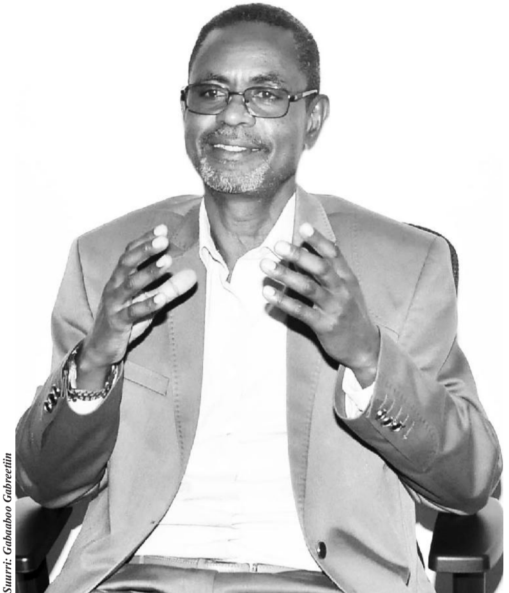
Suurri: Gabaaboo Gabreetiin

Odeeffannoo fedhe funaanuu qofaaf osoo hintaane, chaanaalii barbaadetti fayyadamee odeeffannoo argate sana nama biraatiif dabarsuu yookiin qilleensarra oolchuufis mirga guutuu qaba. Keeyyanni biyyattii 22s qaamni kamiyyuu odeeffannoo