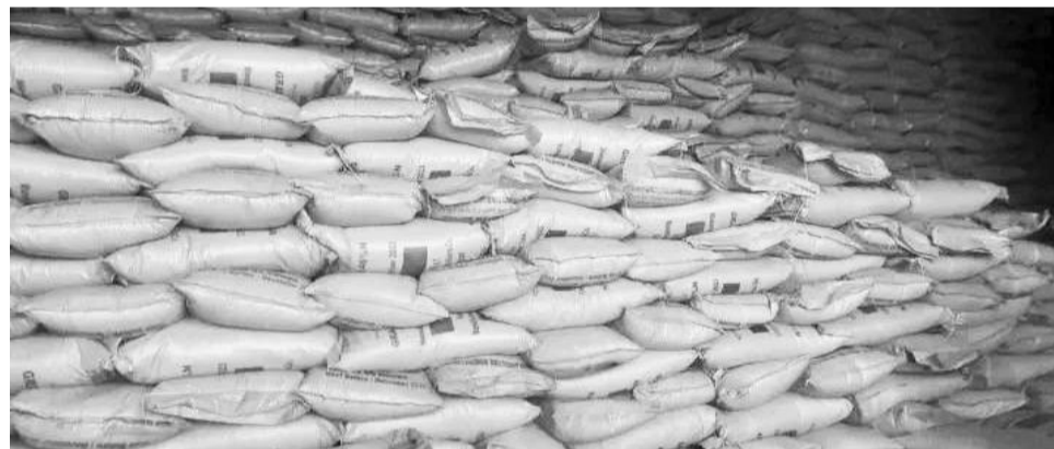
Xaa'oo raabsamaa jiru

Ammaan tana xaa'oon bitames qonnaan bulaa bira karaa yuuniyeeniifi waldaalee