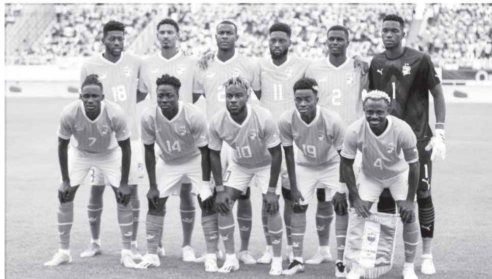
Garee kubbaa miilaa Kootdiivaar