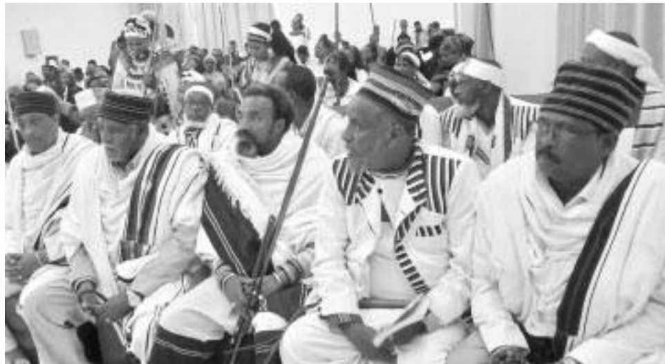
Hirmaattota waltajjichaa keessaa