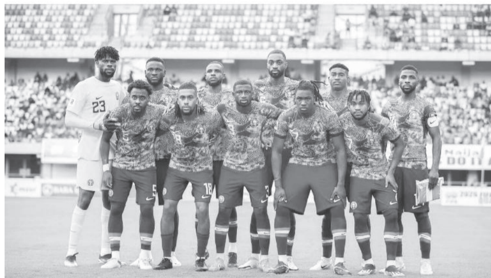
Garee kubbaa miilaa Naayijeeriyaa

hirmaatan keessaa kanaan dura shaampiyooni ta'uudhaan kan beekaman Misir, Kaameeruun, Gaanaa, Naayijeeriyaa, Aljeeriyaafi qopheessituun waancaa Kootdiivaar, Riipaabilikiin Dimokiraatikii Koongoo, Zaambiyaan, Tuuniiziyaan, Senegaaliifi Morookoon waan argamaniif taphichi hawwii guddaan akka eegamu isa taasiseera.