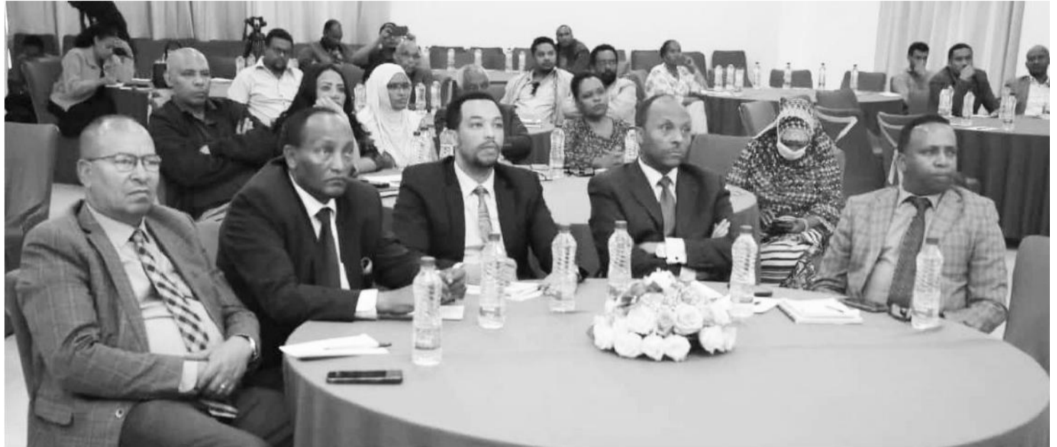
Hirmaattoota marichaa keessaa

Akka ibsasaanitti, tajaajila bishaanii lammiilee hunda qaqqabsiisuuf qindoomina qaamolee hundaa kan gaafatu ta'uusaatiin ministeeroota barnootaa, fayyaa, maallaqaafi dhaabbilee tola ooltota waliin hojii bal'aan hojjetamaa jiraachuu himanii,