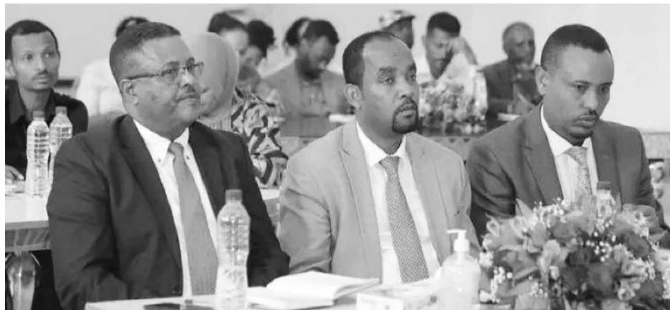
Hirmaattota marichaa keessaa

“Hariiroon hojjetaafi hojjechiisaa gidduu jiru nageenya industirii mirkaneessuu keessatti gahee olaanaa waan qabuuf qaamolee lamaan gidduutti hariiroo gaarii uumuun barbaachisaadha. Hojjehistonnis mirgaafi