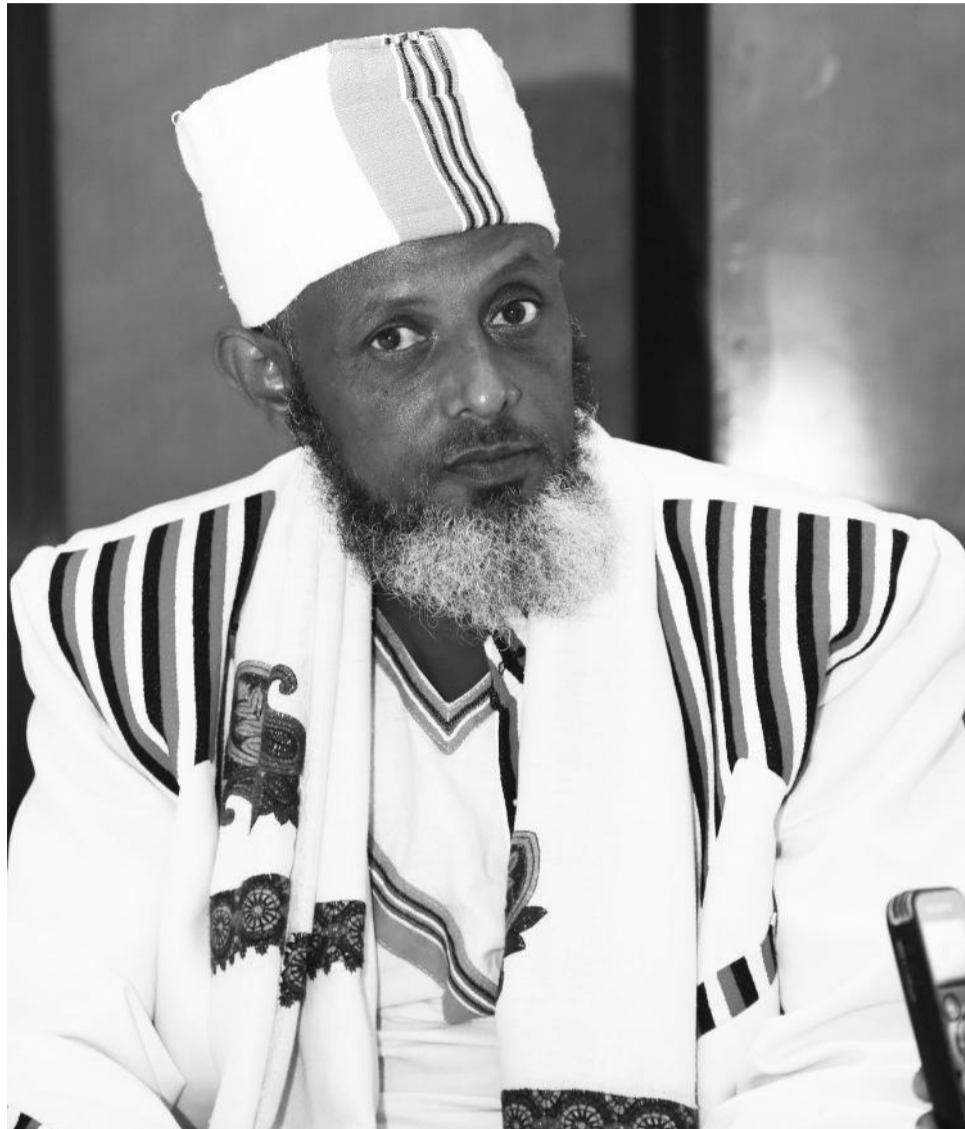
Suurri: Haddash Abrahantiin

keenya maqaa keenya. Wallo ganamumaa kaasee waloomina qaba. Gaddatti gammachuutti, argachuutti, dhabuutti, qabsoorratti waliin dhaabachuun daangaa eenyummaa, duudhaafi sirnoota keenya kabachiisuu dandeenyeera.