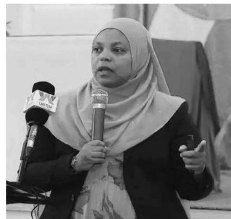
Aadde Mufariyaat Kaamiil

Haalli kenniinsa tajaajila liqiifi sassaabbii intarpiraayizootaafi kenniinsa sheediis hojii