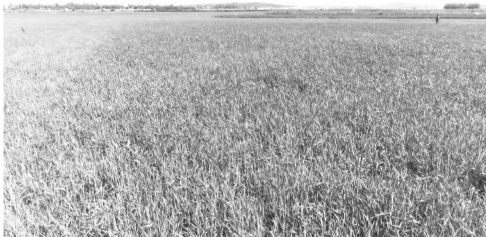
Omisha qamadii bonaa callaa baay'etu abdatamaa jira