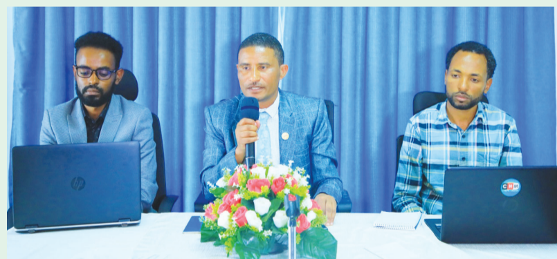
Wayita yaa'ichi gaggeeffametti

Manichis heektaara 10 irra kan qubatu yoo ta'u, wayita ammaa heektaara tokkoratti dhagaan bu'uura kaa'amee hojiitti seenameera jedha. Waldichi akkuma kanaan dura omishawwan garagaraa gatii madaalawaadhaan bitattootaaf dhiheessaa ture, ammas ayyaana Qillee ji'a tokko booda kabajamuufis wantoota barbaachisoo dhiheessuuf gamanumaa qophii taasisaa jiraachuu kan hime pirezidaantichi, ammallee mankuusa waldichaa keessa omishaaleen kanneen akka xaafii, barbarree, talbaafi kkfn