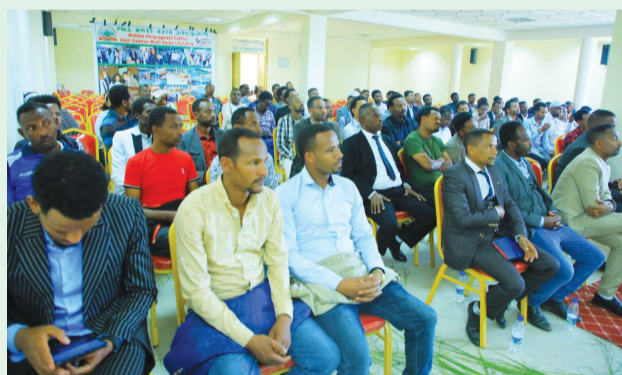
Yaa'ii waliigalaa waldichaa keessaa

Kana malees waldichi akka biyyaatti jaarmiyaa haaraa ta'us raawwii gaariidhaan akka biyyaatti sadarkaa duraarra jiraachuu eeree, kunis cimee akka itti fufuuf manni marichaa kan hojjetu ta'uu kaasa. Waldichi hojiisaatiin adda duree ta'uu kan danda'es fayyadamummaa miseensotasaa waan mirkaneessuuf, wantoota barbaachisoo ta'aniin mootummaa cinaa hiriiree dirqamasaa ba'achuun, caasaa dargaggootaa ilaalcha, hojiifi xiinsammudhaan cimaa ta'e ijaaruufi hojiilee birootiin ta'uu hima.