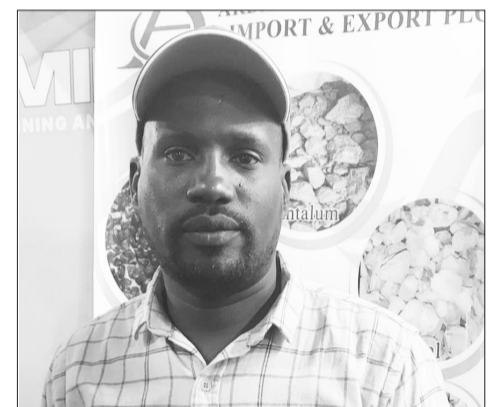
Dargaggoonni Dassaalany Gammadaati.

"Toorri xiyyeeffannoo mootummaan misooma albuudaarratti qabuufi dargaggoota fayyaduu danda'u qabatee ka'e har'a anaafi hiriyyootakoo dinagdeen cimsaa jira. Kunoo har'a qofaasaa dhaabbata misoomaafi algeriif albuudaa Ardaa Sabbaa jedhu hundeessuun dinagdeekoo jabeessaan jira. Godina Gujii keessa albuudota gatii jabeessi akka Daloomaaytii, Warqee Giraanaaytiifi kan biroo nama dhuunfaa miti biyya kana jijjiiruu danda'an hedduudha. Haata'utii teknolojii ammayyaan fayyadamuun ofis ta'e biyya ofii dinagdeen jabeessuuf ammallee dhimma xiyyeeffannoo