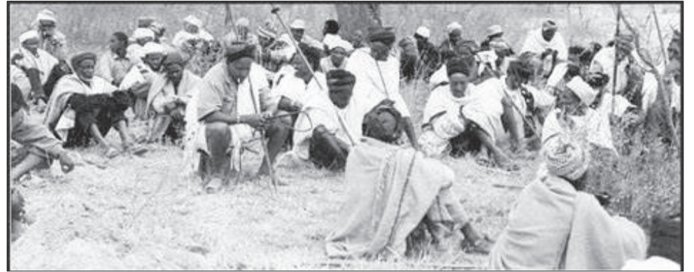
Aadaa jaarsummaa biyyi muuxannoo taasifachuu qabdu