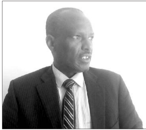
Obbo Dastaa Dinqaa ibsa