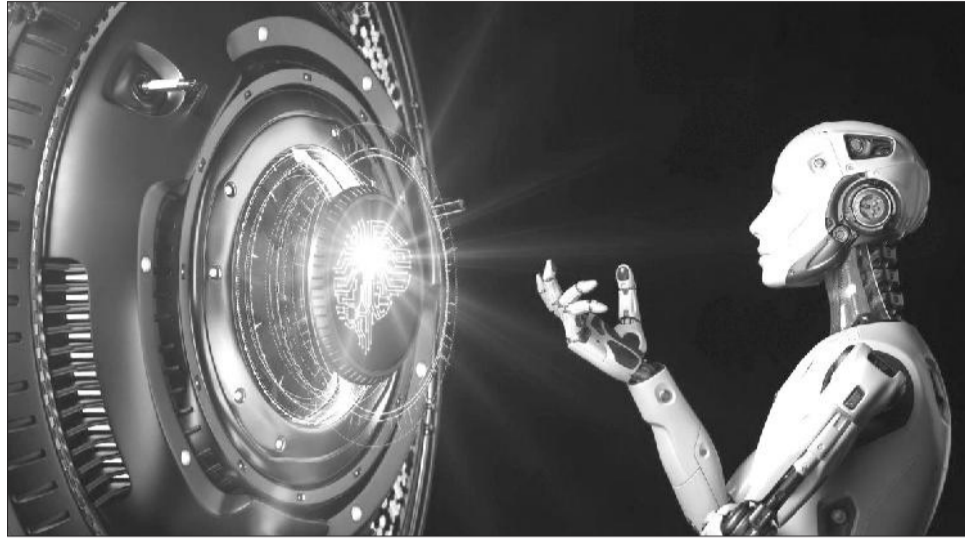
Intalajansiin artafishaalaa sirnaan fayyadamuun rakkolee ulfaatoo hiikuuf furmaata

Seenaa intalajansiin artafishaalaa yoo ilaalle,