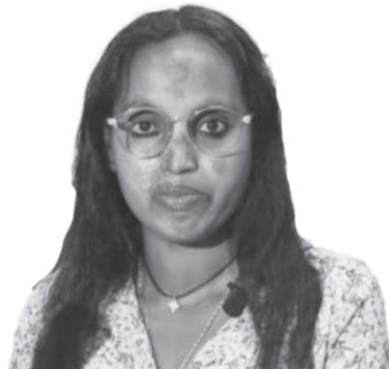
Aadde Iyyarus Mangistuu

kitaabileen barnootaa kutaa 9ffaa akaakuu barnootaa shan kuma 575 ol isaan qaqqabsiisuu himanii, kitaabilee kanneenis yeroo gabaabaa keessatti barataa biraan ga'uuf sochiin eegalu eeraniiru. Kitaabileen barnootaa kutaa 10ffaa hanga 12ffaatti jiran hanga ammaatti akka isaan hinqaqqabneefi yeroo dhiyootti akka isaan qaqqabu itti himamuus dubbataniiru.