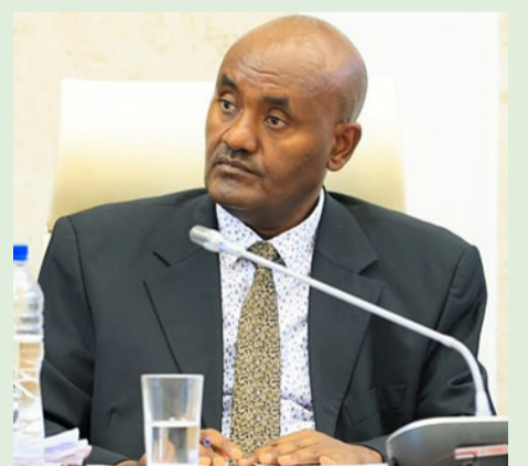
Obbo Unatuu Allanaa danda'eera.

Ibsa bal'aa koree dhimmoota dimokraasiitiin dhihaate kanarratti marii bal'aa kan gaggeesse manni maree bakka bu'oota ummataa, fooyya'iinsi labsichaa barbaachisaa ta'uu hubachuudhaan labsii dhihaate sagalee guutuudhaan raggaasisuu