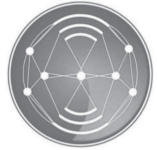
የፌዴራላዊ የመንግሥት ኮሙኒኬሽን አገልግሎት FDRE Government Communication Service

Torban lamaan darban keessa gareen shororkeessummaa kun dogoggora darbanirraa barachuun qabxiilee mariisaa sadarkaa biyyattiin irra geesse waliin