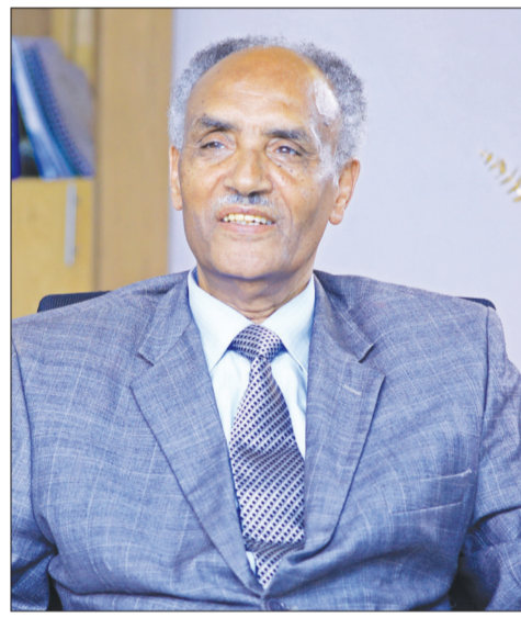
Pirofeesar Bayyanaa Pheexiroos