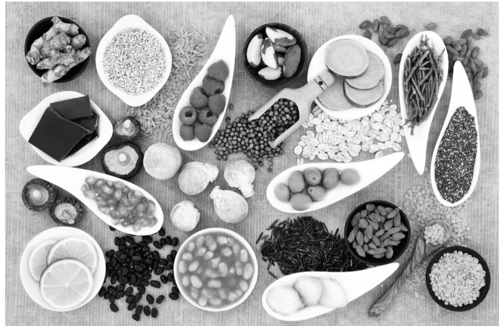
Sirna nyaataa sirrii qabaachuun fayyummaa lammileef

Wayita ammaa akka biyyaatti quucarummaan %39, huqqinni %11, ulfaatinaa gadi %22 dabalataan ammoo ulfaatinni garmalee dhibbantaa ja'arra jiraachuu himanii, kanneen sirreessuun lammiiileen jireenya gaarii akka jiraatan, guddinni biyyaa akka