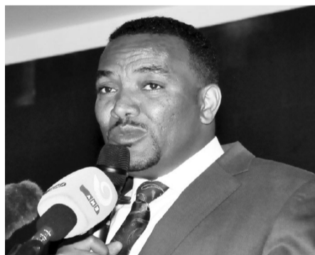
Suran Gabaaboo Gabireetiin