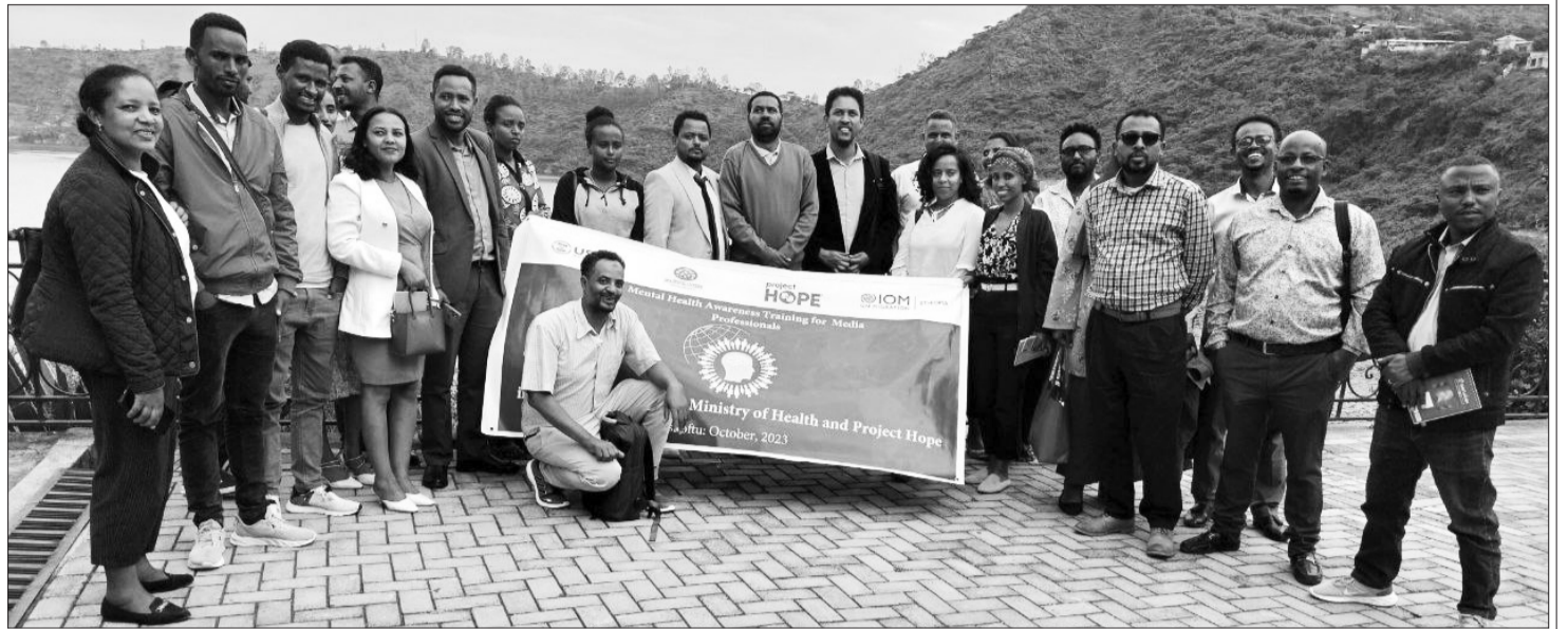
Gaazexeessitoota leenjicharratti hirmaatan

akka dhibee sammuu salphaatti hiika itti kennuun rakkisaa ta'uufi fayyaa sammuu jechuun faallaa dhibee sammuu jechuu akka hintaane ibsu. Kanaaf, fayyaa sammuu keessatti dhibeen sammuu dhibuun ulaagaalee keessaa tokko yoo ta'u, isarra darbee namoonni gammachuudhaan jiraachuuf humna qaban baasanii itti fayyadamuullee kan hammatu ta'uusaatiin fayyaa sammuu jechuun, adeemsa jechuun ni danda'ama.