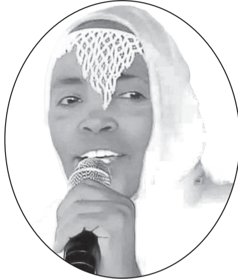
Artisti Halloo Daawwee

Hawwiisichi bu'ura hawaasa bal'aarratti kan ijaarame, gargaarsa ummataatiin meeshaa muuziqaa ammayyaa kan hidhate, rakkoo hanqina artistoota shamarranii