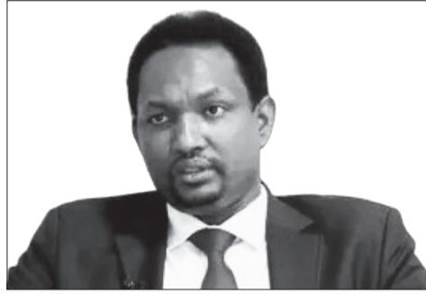
Obbo Taarraqany Bulultaa