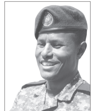
Inispeektar Kaliifaa Qixxeessaa