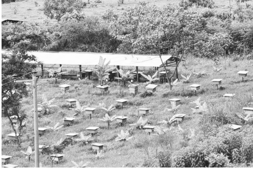
Bu'aa ashaaraa magariisaa keessaa (gaagura kanniisaa)