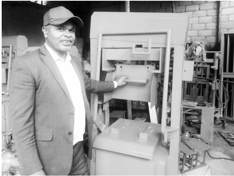
Obbo Baqqalaa Sabsibee fi maashinii bilookkeettii omishaa jiran

Meeshaalee biiroo, foddaa, cufantaa (balbala)fi maashinii bilookkeettii hojjechuun akka baran kan dubbatan Obbo Baqqalaan, booda dhaabbata dhuunfaa (Xaaliyaanotaa) Markaatootti argamuuf sibiila hojjetanii maqaa Diifteerii jedhamuun beekaman bira galanii guyyaatti qarshii saddeet