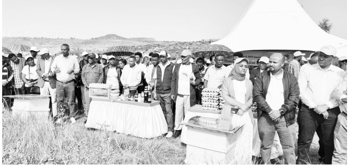
Wayita bu'aan argame daaw'atametti