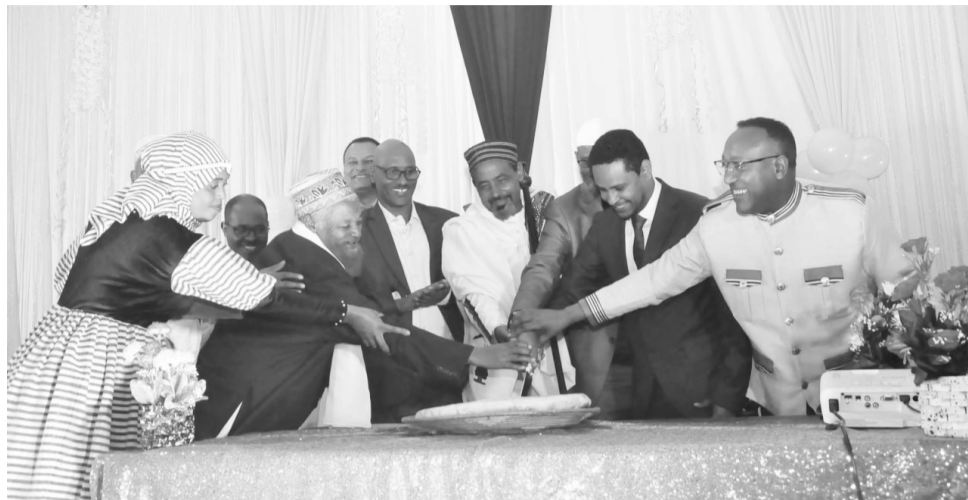
Waloomba...waloomba ammas waloomba

Waloombni keenya humna keenya. Waloomba keenya cimsuun nageenya waaraa buusuufi guddina hawaas-dinagdee keenya caalaatti mirkaneessuuf gargaara. Waljibbuun, waltuffachuun, maqaa walxureessuun,