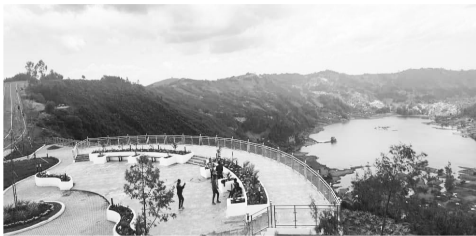
Pirojektota hawwata turistiif ijaaramaa jiran keessaa

Humnoota hidhatanii socho’an hundaaf waamicha nagaan buusuu taasisanii, bara haaraatti qaamni kallattii kamiinuu hidhatee Oromiyaa keessa jiru mariin akkasumas waltajjiitti dhufee nagaan Oromoofi qe’ee Oromootiif gumaachasaa bahachuu qaba jedhaniiru.