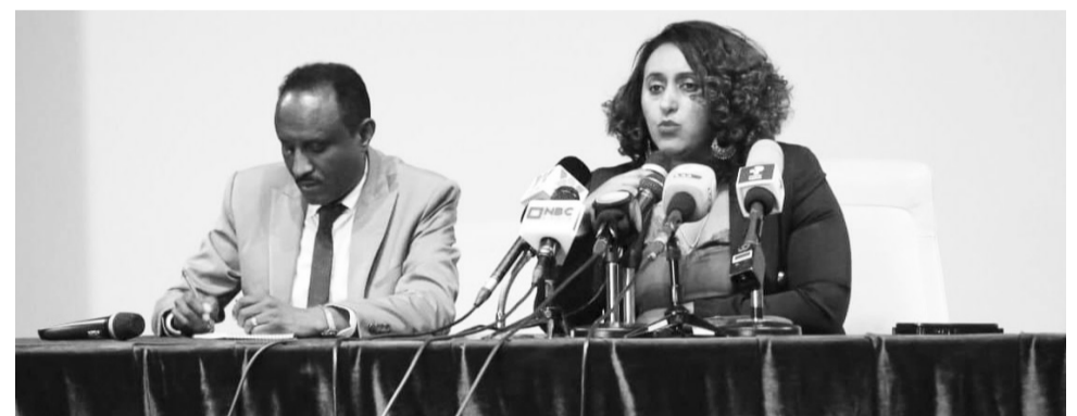
Aadde Liidiyaa Girmaa wayita ibsa kennanitti

Milkaa'inni Hidha Abbaayyaa hiyyummaa diiguun dinagdee biyyaa guddisuun waan xixiqqooratti waldhiibuufi wal-diiguun hafee wajjoomina ummatoota biyyaalessaa akka cimuufo shooraa olaanaa akka qabu ibsaniiru. Milkaa'ina Hidha Abbaayyaa haga ammaatti galmaa'een onnachuun isa hafe xumuruuf qaamoleen ilaallatu marti tumsaa irraa eegamu hunda akka taasisaniif Ambaasaaddari Diinaan waamicha dhiyeessaniiru.