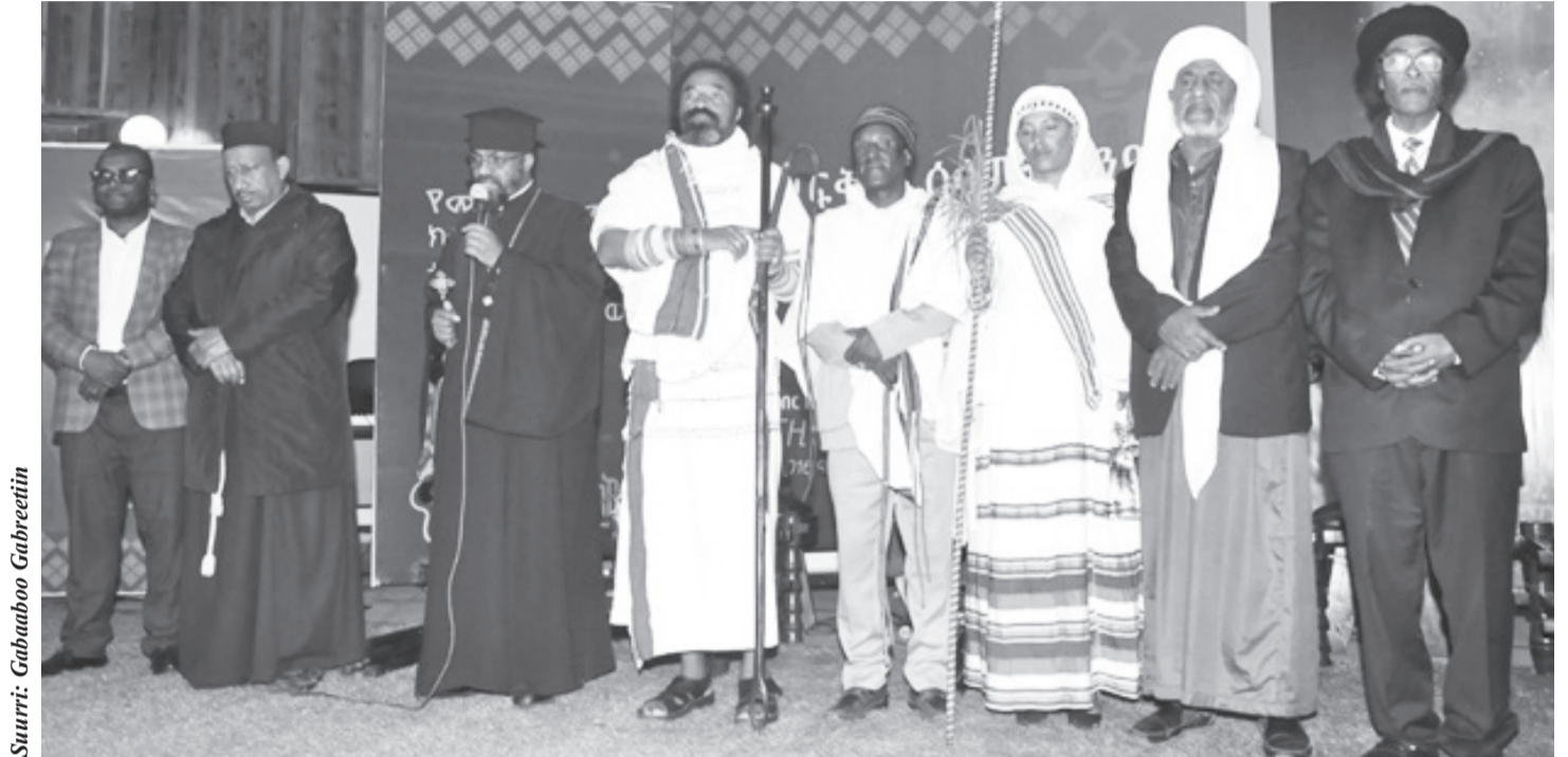
Suuri: Gabuuboo Gabreetiin

Bataskaana Ortodoksii Itoophiyaatti, Ittigaafatamaan Qajeelcha Lallaba Wangeelaafi Ergama Duuka Bu’ummaa