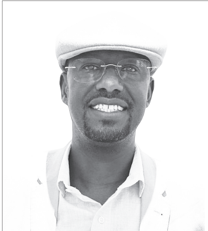
Doktar Tuqaa Jirmoo

Itoophiyaanis paarkiiwwan hedduu qabdi. Paarkii Biyyaalessaa Gaarren Baalee kan dhiyeenya kana 'UNESCO'tti galmaa'es