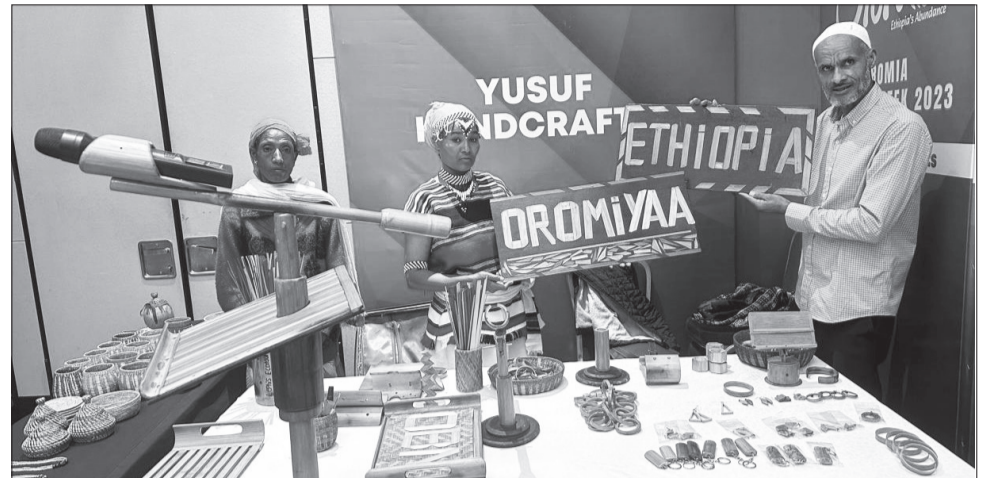
Omishaalee Obbo Yusuuf Mahammad dhiyeesan keessaa

Agarsiisawwan sagantaa Torban Turizimii Oromiyarratti dhiyaataniin hojjelee abdi hedduu namatti horan argineerra kan jedhan Obbo Shimallis, gama birootiin carraa hojii seektarichi maddisiisu: tajaajila geejjibaa, dhiyeesii meeshaalee aadaa, madaqsa teknoolojii, tajaajila hoteelaafi iddoowwaan bashannanaafi kan kana fakkaatan irraa fayyadamaa ta'uuf hataattamaan