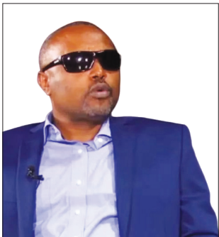
Sooraa Haddiis Isheetuu