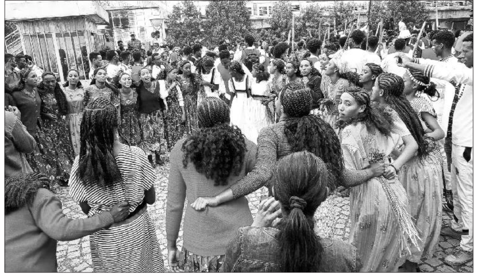
Ayyaanota tibba kanatti shamarraniin kabajaman keessaa