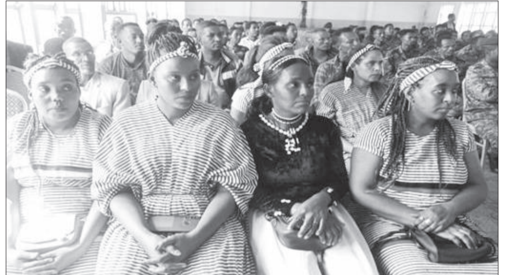
Nageenya godinichaa caalaatti cimsuuf mariin murteessaadha

Ammaan tana aanaalee 12 godinichi qabu keessatti caasaan mootummaa hojii idileesaa