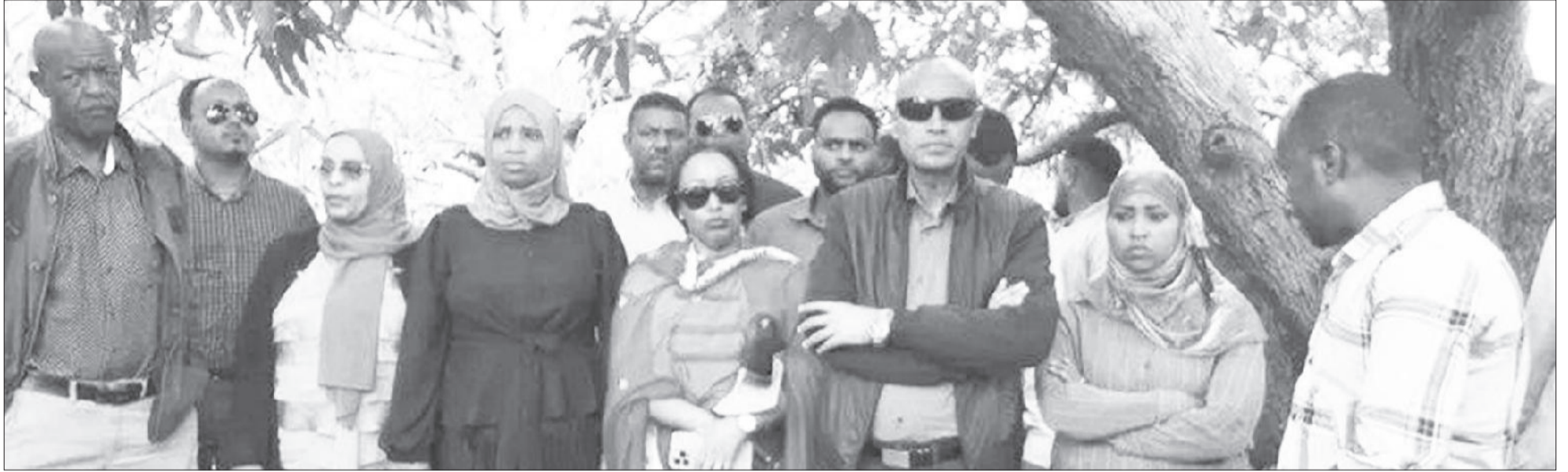
Jilli Obbo Binnaalfiin durfamu wayita daawwannaa taasisetti