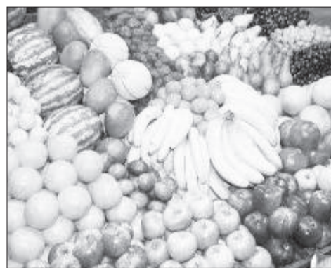
Akaakuu muduraalee garagaraa

sagantaa idileefi duula biqiltuu dhaabuutiin akka ta'e daarektarii kun ibsaniiru. Biqiltuu muduraa kunneen baay'inaan kan dhaabbatan jiraachuu Adoolessaafi Hagayya keessa ta'uu himanii, hanga ammaatti biqiltuu muduraa miliyoona jaha ta'u godinoota adda addaa keessatti dhaabamu yaadachiisaniiru.