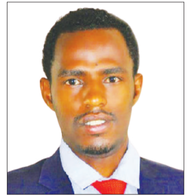
Dargaggoota Hararii tola ooltummaarratti