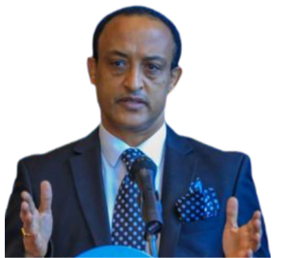
Ambasaaddar Mallas Alam