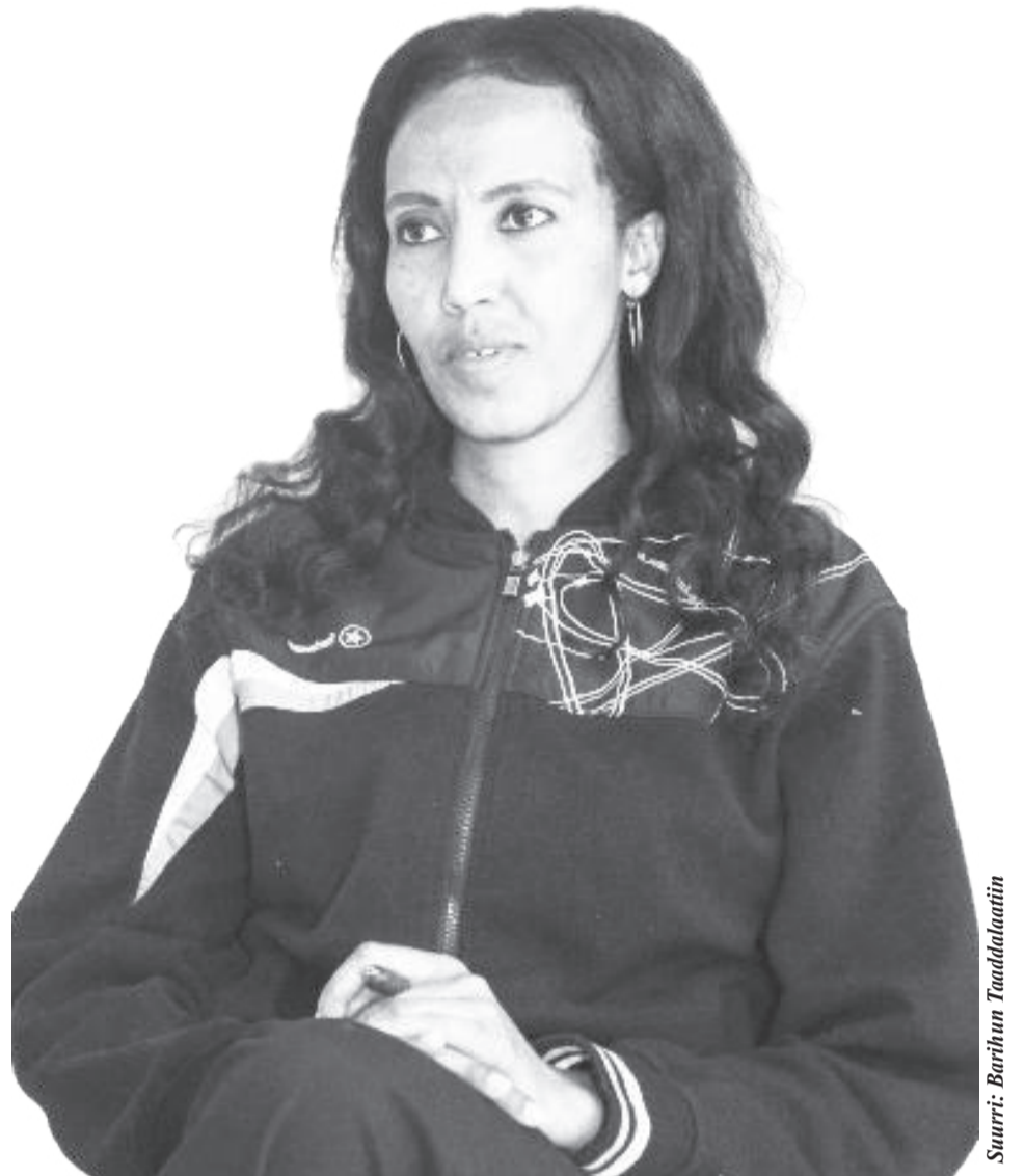
Sturri: Bariisaa Taaddalaatiin

Qormaata addaan kutee guyya saddeetiif akka malee dhukkubsadhee riifariitiin gara Finfinneetti akkan dhufu ta'e. Kanarraa kan ka'e barnootakoo addaan kuteen yaalarran ture. Of duubatti deebi'eellee sababa dhukkubaan addaan kutuukoof beeksisuu dadhabeen abdi kutannaa keessa galeen ture.