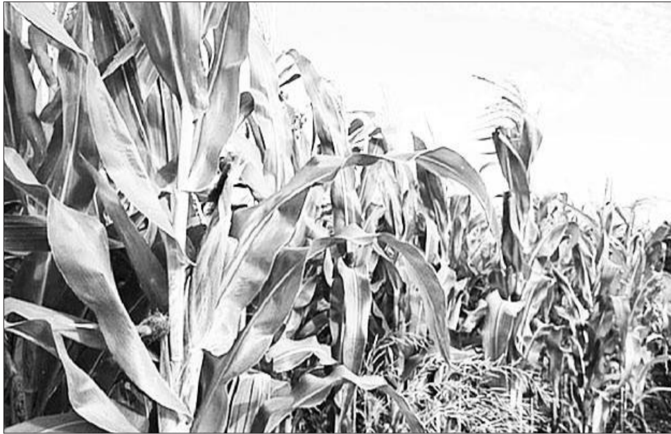
Baayoo teknolojiidhaan omishtummaa dabaluu irratti hojjetamuu qaba