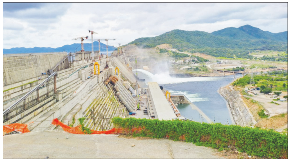
Pirojektii hidha haaromsa guddichaa

hawaasaa dabaluuuf hojii magaalota gurguddoo 58 keessatti hojjetameen hirmaannaa ummanni milkaa’ina ijaarsa hidhichaaf taasisu dabaluu eeranii, maallaqni hirmaannaa hawaasaatiin bara kana walitti qabamees yeroo walfakkaatu