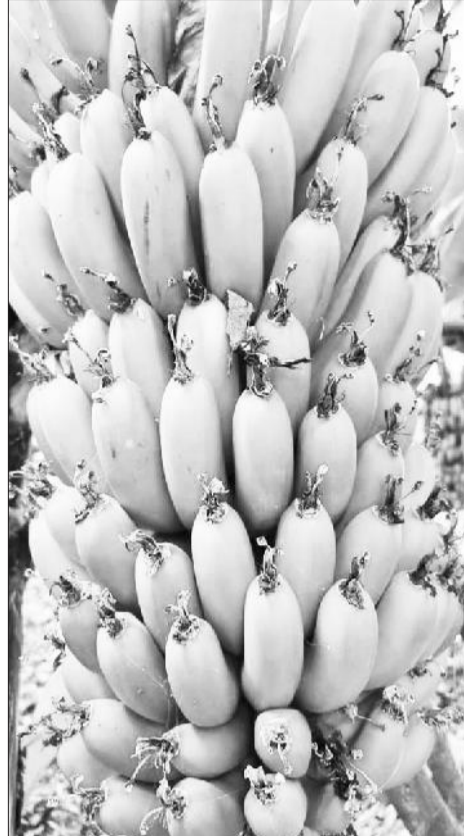
Inisheetiivoota ruuzii, muuziifi boqqolloo