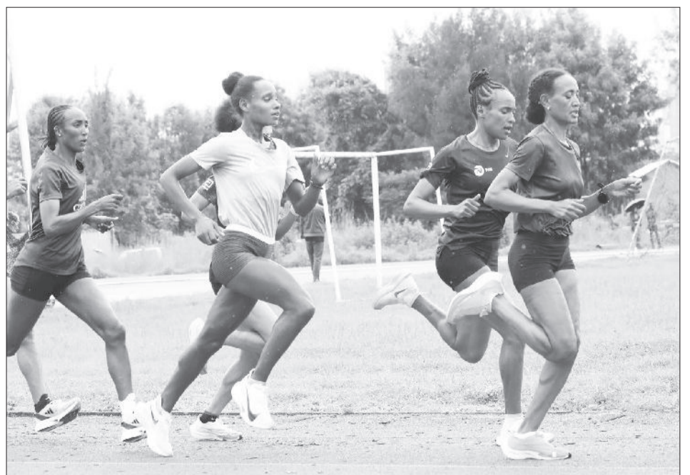
Atileetoota shaakallii taasisaa jiran keessaa