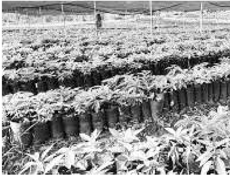
Biqiltuwan dhaabamaa jiran

Gama wabii midhaan nyaataa mirkaneessuutiin Sagantaan Ashaaraa Magariisaa shoora olaanaa qabaachuu ibsanii, sagantichaan biqiltoonni kuduraafi muduraa baay'inaan akka dhaabbataniif xiyyeeffannoon addaa itti kennamee