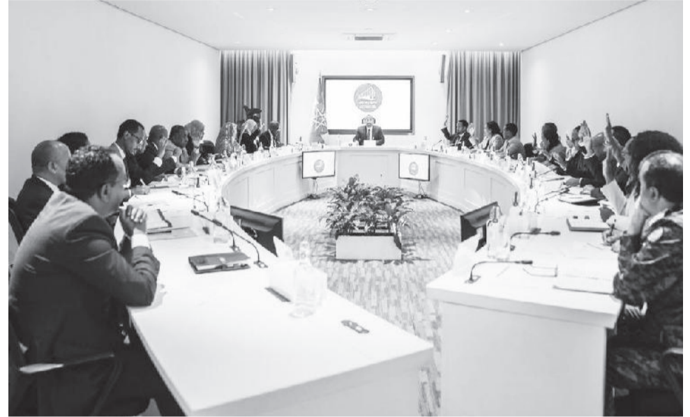
Miseensoota mana maree ministirootaa

Mootummaan naannichaa miidhaa qaamoleen finxaaleeyyii naannichatti