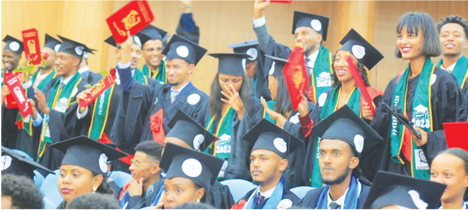
Sirna eebba barattoota keessaa