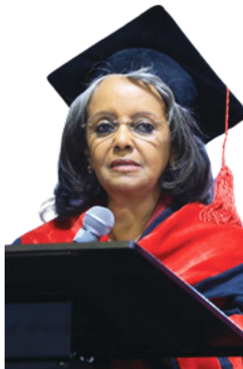
Aade Saahilawarq Zawudee