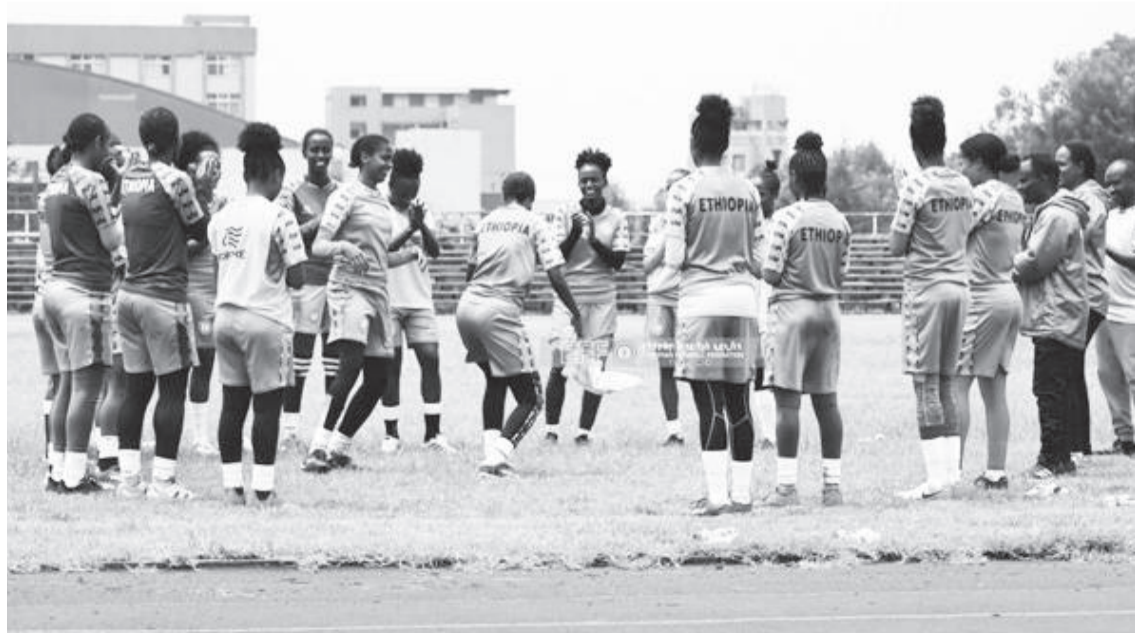
Garichi wayita qophii taasisutti

Biyyoota miseensota seekaafaa keessaa ja'a qofti kan irratti hirmaatan dorgommiin kun ramaddii tokkoon kan adeemsifamu yoo ta'u, kana keessaa kan qabxii olaanaa galmeessise injifataa dorgommichaa akka ta'u beekameera.