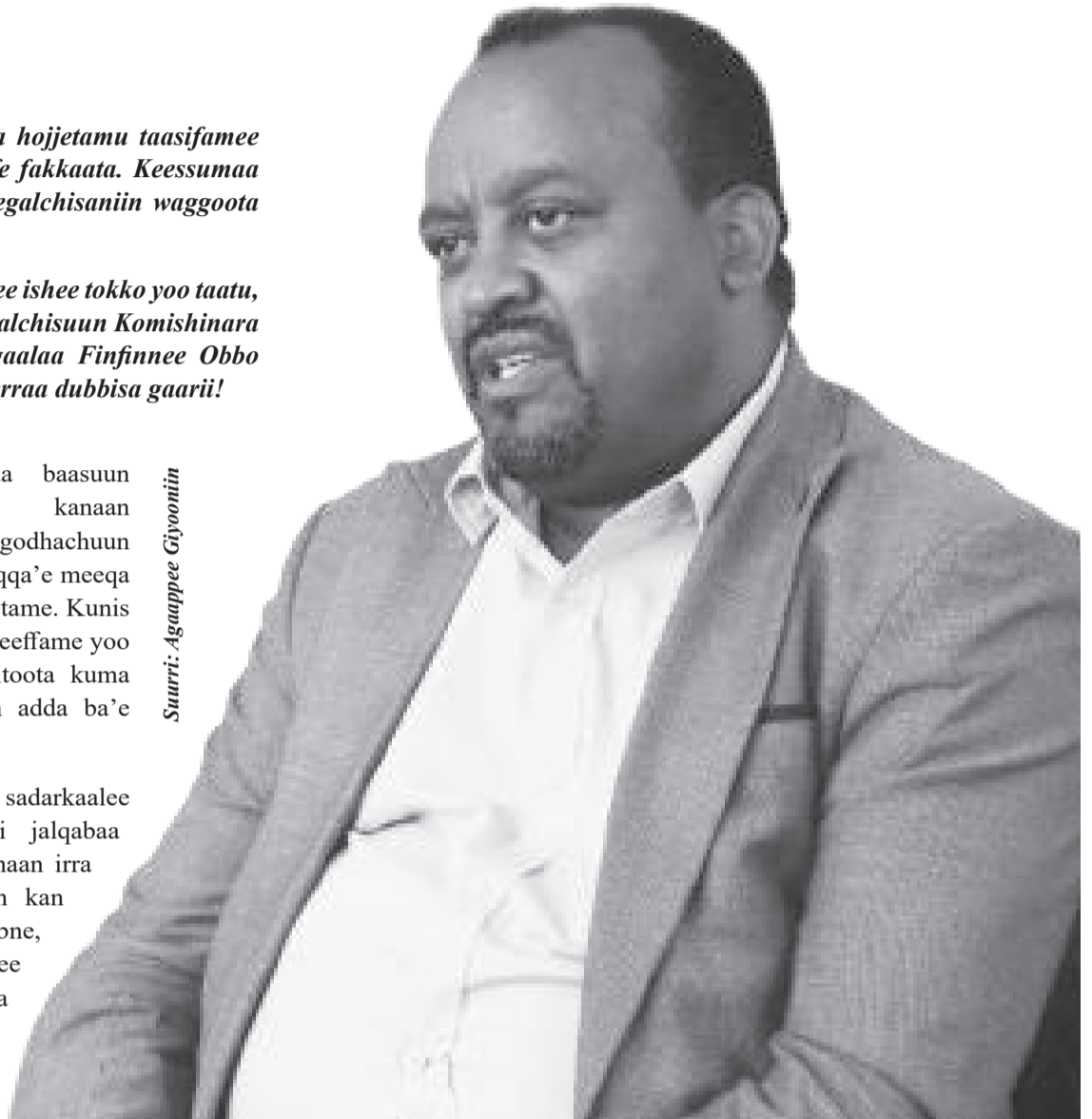
Suurri: Aguupee Giyoontin

Akkasumas ogummaasaanii giddugaleessa godhachuun horsiisa beeyladaa, annan loonii omishuufi furdisu akkasumas lukkuu horsiisuurratti qarshii biliyoona tokkoo oliin giddugalli pirojektii marsaawwan sadiin ijaaramaa