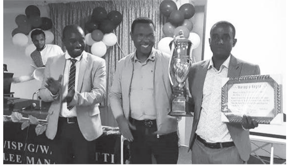
Beekamtiin wayita kennematti