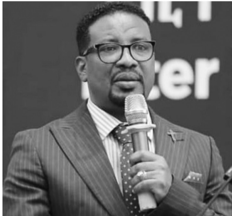
Qesisa Taagay Taaddele

shiqisha ikkana, hiikko qooxeessira hiitto laalcho laashsha hasiissanno yaannohano buuxa hasiissannota huwachishanno.